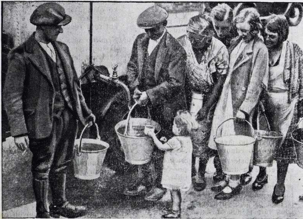
Pri nas preveč, na Angleškem premalo. Medtem ka je pri nas že precij preveč vode, na mesta pa v nešterih angleških okrajih vlada süša. V okrajih Etdworth pri Doncastri morajo vodo voziti v posebnih avtomobilih, kam jo hodijo žedni prebivalci iskat.

nekaj števil, ki nam bodo povedale več, ko dolgi članki. Karitas v dunajski nadškofiji uživa veliko zaupanje. To je razvidno zlasti iz naraščanja njenih zavarovancev. N. pr. 1. 1933. se je pri njej zavarovalö 12.469 oseb, 1. 1935. pa 23.063 oseb. Med zavarovanimi je tudi dunajski nadškof, kardinal dr. Innitzer. On je obenem tudi član kuratorija. V navedenih dveh letih je umrlo 3165 zavarovancev in je Karitas njihovim domačim izplačala 918.475 šilingov (okrog 7 in pol milijon Din.) V vseh letih obstoja je umrlo 8000 zavarovancev in je bilo izplačano 2 in pol milijona šilingov (okrog 20 in pol milijon Din.) V celi Avstriji je bilo med zavarovanci pri Karitas 40.000 smrtnih slučajev in je Karitas izplačala v teh slučajih 9 milijon šilingov (okrog 72 milijon Din.) zavarovalnine. Številke govoriyo. Povedo to, da je imela smrt tudi med zavarovanci bogato žetev. Povedo pa tudi to, da je bilo na tisoče družin ob smrti svojcev rešenih najhujšijh skrbi, ker jim je bilo z izplačano zavarovalnino omogočeno kritje pogrebni i drugih stroškov. In še nekaj povedo številke. Vsakemu priporočajo, naj čim prej zavaruje sebe in svoje pri Karitas, da tako reši sebe in njih velikih skrbi. Obrnite se na domače zastopnike ali na vodstvo Karitas v Mariboru, „Orožnova ul. 8 in se zavarujte!