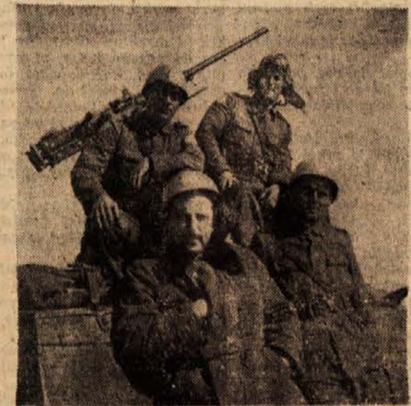
Naši fantje na poti skozi puščavo na Sinaju

Naslednje dni sem bral vest, da se poročilo polkovnika Banksa ujema s pisanjem polurnega egiptovskega lista »Al Gumhurija«. Britansko vojno ministrstvo je poročalo, da ga je