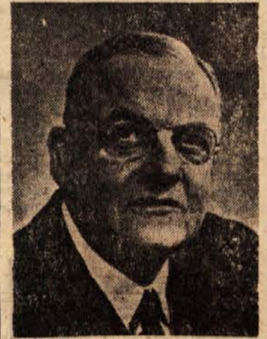
Državni tajnik za zunanje zadeve John Foster Dulles