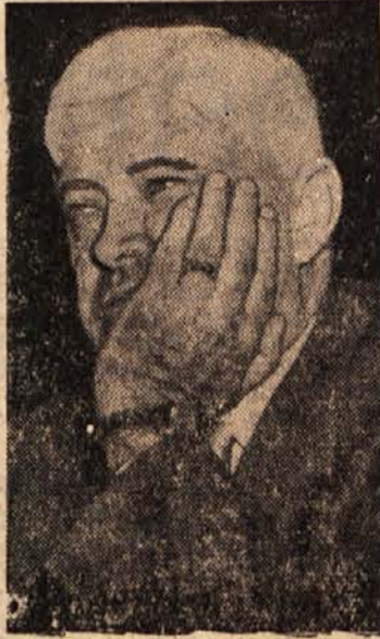
Obrambni minister Charles Wilson

Dunaj, 17. februarja. (Tanjug.) Avstrijski kancler Raab je v govoru, ki ga je imel v nedeljo po avstrijskem radiu, izjavil, da se je avstrijski presežek uvoza nad izvozom (ki je znašal predlansko 5 milijard šilingov) zmanjšal lani na 3,2 milijarde. Leta 1956 je narasel avstrijski izvoz v primerjavi z letom 1955 za 2,25 milijarde šilingov, izvoz pa je v istem obdobju narasel za 4 milijarde šilingov. Dohodki od turizma so se lani v Avstriji povečali od 1 na 3 milijarde šilingov. S tem je bil v celoti krit primanjkljaj v trgovinski bilanci.