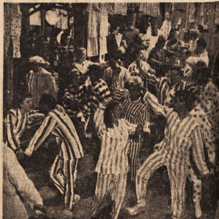
V Hollywoodu snemajo film o najnovejšem plesnem popadku »Rock and Roll« v pižamah. Pravijo, da bo v tem filmu vrvež, ob katerem se bodo gledalci nasmejali do solz. V glavni vlogi nastopa tekstilna tovarna, ki jo predstavlja predsednik personalnega urada. Višek doseže zgodba s stavko v pižamah.

Bober pogosto zgradi jez tudi sto metrov daleč od svojega brioga, vendar vselej točno doseže zaželeno višino vodne gladine. Z gradnjo takšnih jezov zastaja voda v globokih jezerih, ki varujejo ribe in hkrati ustvarjajo tudi naravno zaščito pred gozdnimi požari. Temu je treba dodati še to, da se na ta način izboljšuje tudi zemlja in preprečuje odplavljanje. Zaradi znatnih koristi so v Kanadi bobre pred nekaj leti zaščitili s posebnim zakonom, ki prepoveduje lov na to žival v določenih letnih časih. Sicer je bobrovo krzno še danes precej vredno, zlasti dragoceno pa je bilo v minulem stoletju, zato so se takrat številni lovci neusmiljeno gnali za bobri.