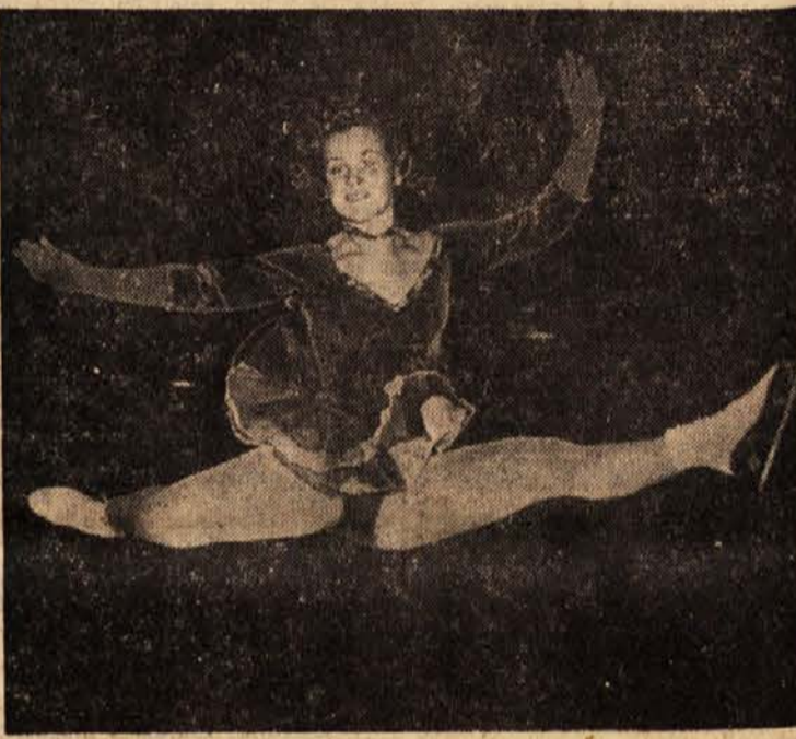
Dunaj, 17. febr. (DPA). — Avstrijska drsalka Hanna Eigel je osvojila prvo mesto na evropskem prvenstvu v umetnem drsanju, ki je bilo sinoči končano na Dunaju. Lanska zmagovalka Ingrid Wendel je osvojila letos drugo mesto, Hanna Walter pa tretje. Naša slika prikazuje letošnjo evropsko prvakinjo pri uspešni figuri.