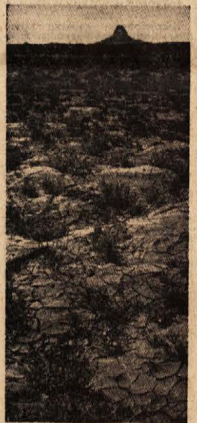
Močno je razpokala zemlja v jugozahodnih deželah ZDA, ki jih je v minulih mesecih zelo prizadela suša.

Prebivalci neke italijanske vasi so bili pred kratkim presenečeni, ko so zjutraj ugotovili, da jim je nekdo ponoči ukradel leseni mostič čez vsaki potok. Policija je ugotovila krivice: sosednja vas je iznenada na vso moč kurila z mokrim lesom in se je kadilo iz vseh dimnikov.