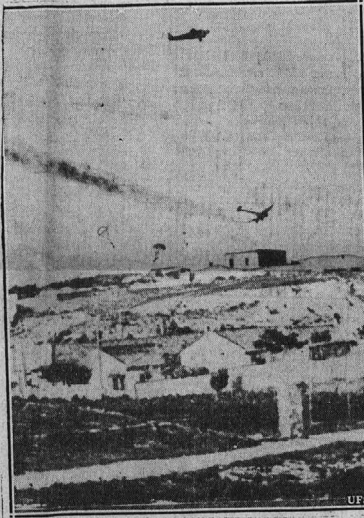
Govnja slika je bila posneta ob priliki nemškega vpada na otok Kreto. Na sliki vidimo nemške zrakoplove, ki so dovažali nemške parašutarje. Eno izmed letal je zadeto in je pričelo greti.