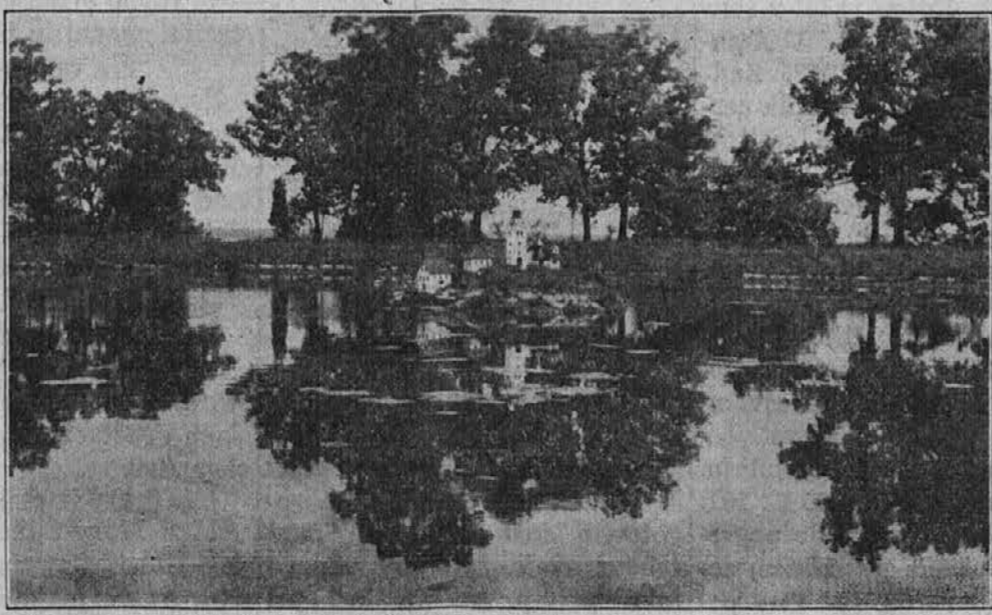
Ameriške slovenske Brezje v Lemontu, Ill.