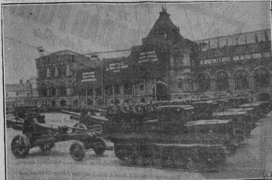
Slika nam predstavlja skupino ruskega motoriziranega topništva, ki je na poti na fronto proti Nemčiji, katera si je zaželela ukrajinskega žita in bogatih oljnih vrtecev v Baku.