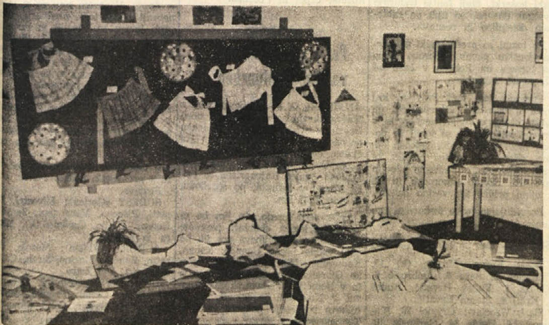
Delen pogled na bogato razstavo ročnih del otrok svetojokobske slovenske osnovne šole