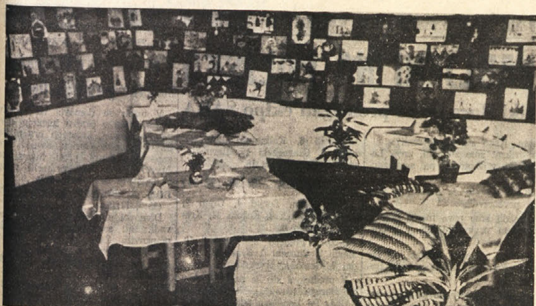
Razstave in prireditve na slovenskih šolah se nadaljujejo. Na gornji sliki vidimo del razstave ročnih del, ki so jih med letom napravili otroci škedenjske osnovne šole