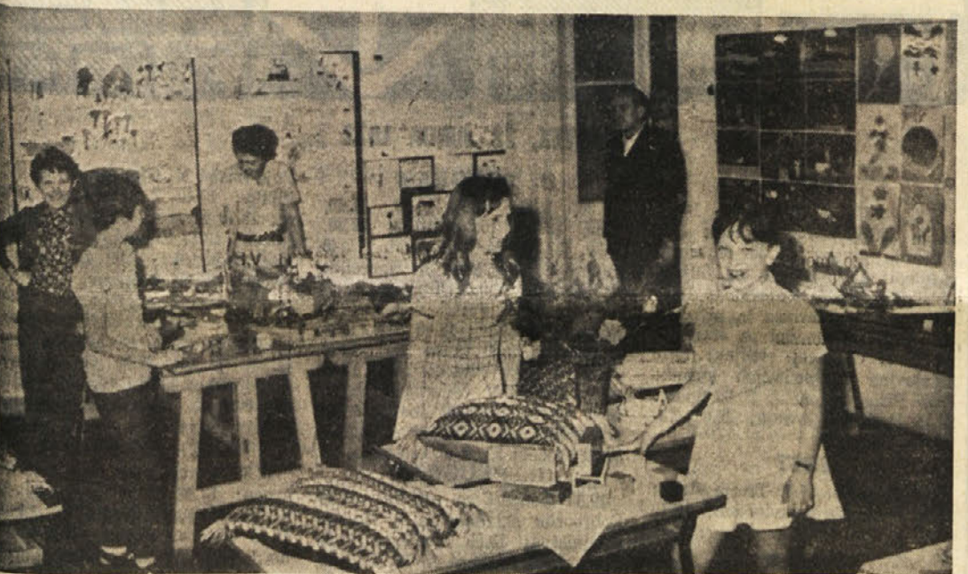
Otroci slovenske osnovne šole v Ul. sv. Frančiška so zadovoljni nad doseženimi uspehi. To dokazuje njihovo razpoloženje na razstavi, ki so jo pripravili tetos