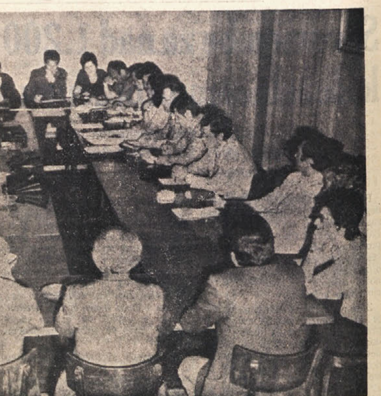
Med sejo glavnega odbora SKGZ

To je torej nekaj ugotovitev v zvezi z našo prisotnostjo na kulturnem področju. Obsežnejše poročilo bi vsekakor moralo posvetiti posebno poglavje stikom z matično domovino, za katere pa velja, da so trenutno nadvse zadovoljivi. Povezani in sodelovanje našega gledališča, Glasbene matice in drugih ustanov z odgovarjajočimi ustanovami in skupnostmi v Sloveniji, kakor tudi SPZ z Zvezo kulturno-prosvetnih društev je zelo tesna in tudi v splošnem poslovanju v glavnem ne prihaja do nesporazumov. Nekoliko slabše je sodelovanje z omejenimi obččinami, predvsem pa zaradi njihovih skromnih možnosti.