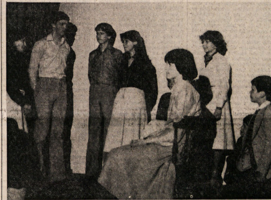
Skupina mladih dijakov na proslavi