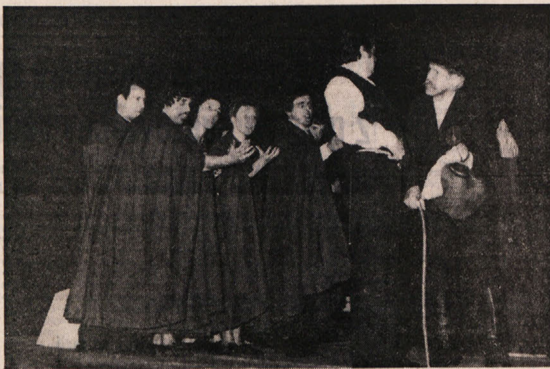
Dramska skupina PD iz Sovodnj je zela tudi med našim občinstvom tople sprejem in priznanja. Prej ali slej se bo verjetno še pojavila na naših odrih z »Jernevo pravico«. Na sliki: prizor iz predstave.