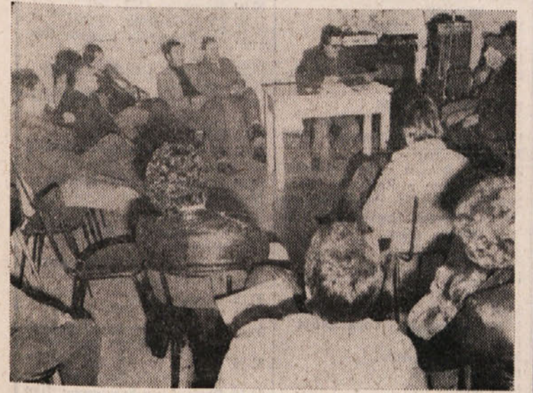
Z javnega sestanka v Mačkoljah

300 let staro lipo sredi vasi bo treba na žalost podreti Vaščani seznanjeni z občinskim proračunom