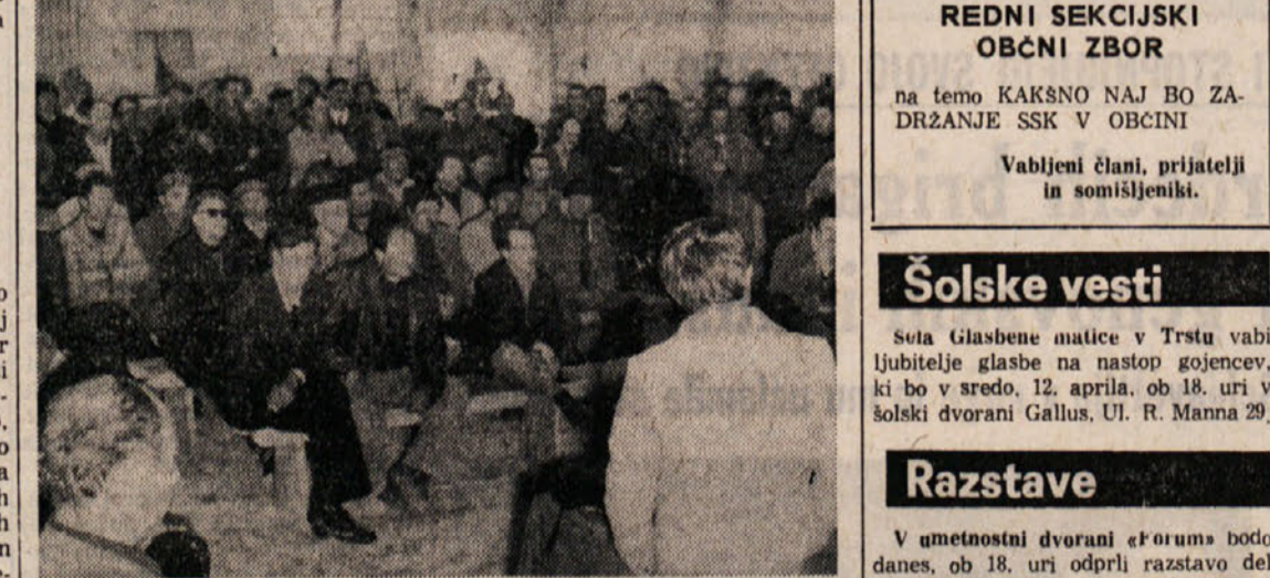
Med sestankom v za sedenem karnolomnu

Odločen sklep bo verjetno v ponedeljek, ko se bo morala uprava podjetja izreči o sindikalnih predlogih - Solidarnostne izjave