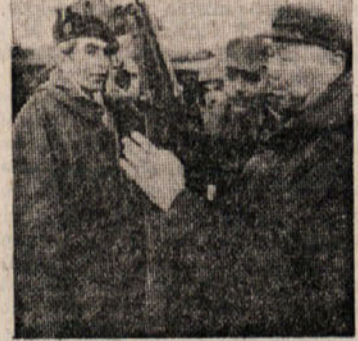
Kitajski in francoski generali si ogledujejo francosko orožje.

Na srečo, pravijo Francozi, je vsa ta zgradba dobila pri izvozu zelo učinkovit dvojni instrument. Gre za »Division des affaires in- ternationales« (DAI), ki spada pod Generalno delegacijo za oboro- ževanje.