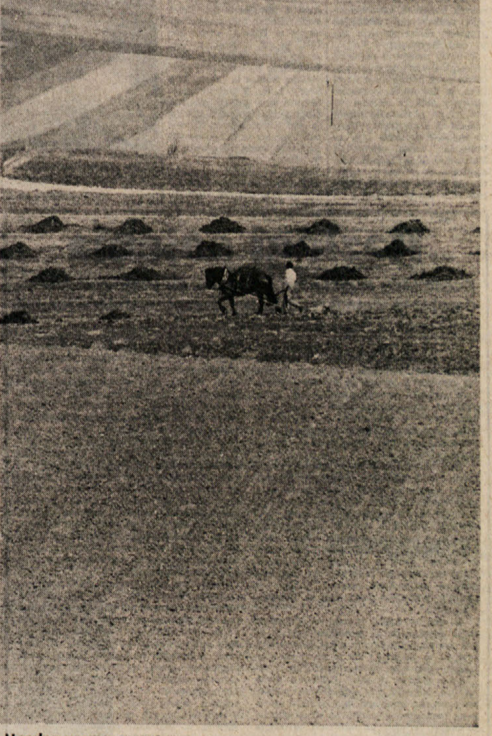
Ugodno vreme za setev

MURSKA SOBOTA, 4. aprila — Medtem ko v Sloveniji šele začnemo s spomladansko setvijo — bolj se bo razmahnila setev setvijo koruze in krompirja — pa iz drugih krajev države poročajo o uspešni setvi jarih žit, sladkorne pese in vrtnin. Čez nekaj dni bodo zasajali največ koruze, ki dobiva v setevnem načrtu zaradi usmeritve v živinorejo in arene dobave ter visokih cen na jugoslovanskem tržišču vedno večji pomen. Računajo, da bodo letos zasajali okoli 60 tisoč hektarjev koruze. Vprašanje je, kaj bo s krompirjem, ki lani ni imel splošne cene. Pričakovati je, da se bodo pridelovalci odločili za isti obseg proizvodnje kot lani, kar pomeni, da bodo krompir zasajali na okoli 40 tisoč hektarjih. R. O.