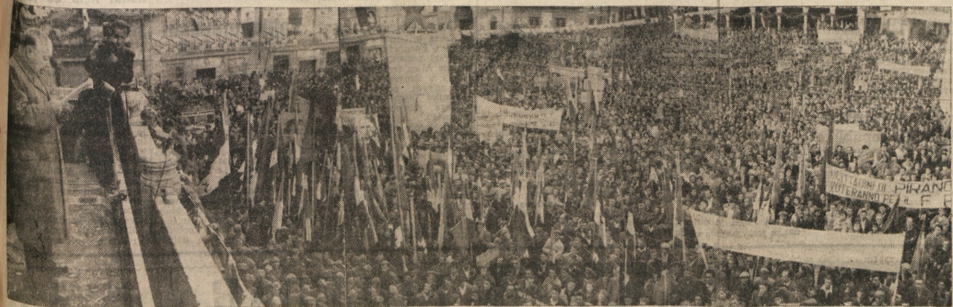
MINISTER TOV, I. REGENT GOVORI V KOPRU NAVDUŠENI MNOZICI ISTRSKEGA LJUDSTVA, KI JE VCERAJ POPOLDNE PREPLAVILA TRG MARSALA TITA.

Ne more biti niti govora o tem, da bi se odpovedali tistemu, kar po vseh naravnih zakonih upravičeno smatramo, da je naše, ker je to rezultat nadčloveških naporov ljudstva v narodno-osvobodilni borbi