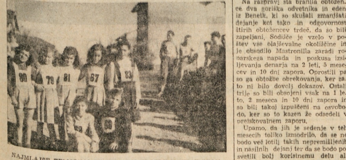
NAJMLAJŠE TELMOVALKE ČEZ DRN IN STRN V ŠTANDREŽU