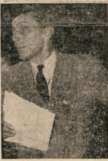
Francoski znanstvenik komunist FREDERIK JOLIOT CURIE, vi- soki komisar za atomsko energijo, ki bo predsedoval svetovnemu kongresu za mir v Parizu.

Nad milijon in 700 tisoč Jugoslo- vanov je padlo v tej borbi in so tako z žrtvovanjem življenja potrdi- li globoko vero v zmago pravice in trajnega miru in v prijateljske odnose med narodi. Vendar pa nista mir in prijateljsko sodelovanje pogodu imperialis- tom v svetu. Narodi sveta si niso