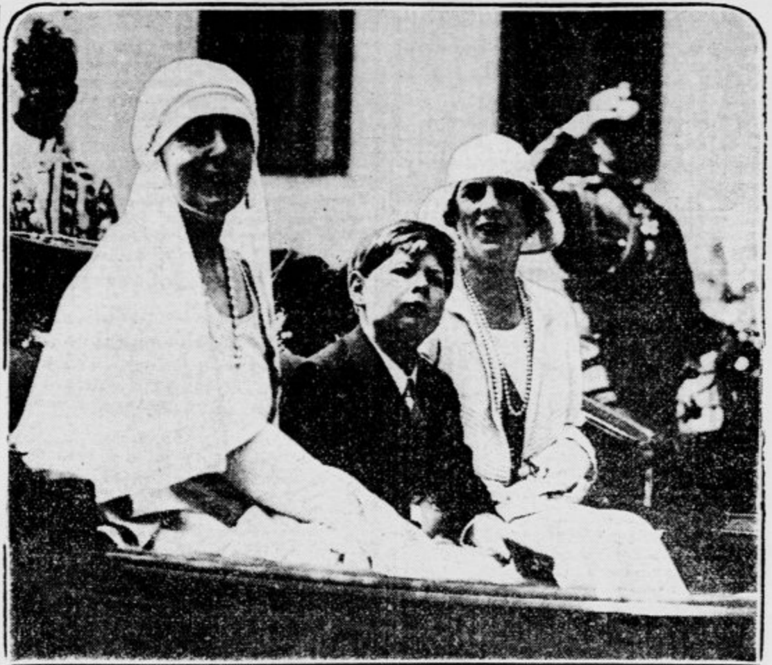
Deseta obletnica Velike Rumunije

V Londonu je te dni umrl 82 letni lord Rosebery, bivši angleški ministrski predsednik. Zadušila ga je pljučnica potem, ko je bil deset let bolan in prikovan na bolniško posteljo. Pokoink je bil eden najpopularnejših angleških državnikov liberalne dobe. Pripadal je stari škotski plemeniški obitelji, v politiki pa se je začel uveljavljati šele kot tritridsetleten mož. Izkazal se je s tem, da je organiziral veliko volilno kampanjo v prid liberalnemu režimu, ki ga je bogato poplačal. L. 1885, je pozval državnik