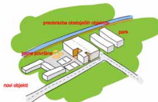
Slika 2: Konceptualne sheme, principi urejanja [Gašper Arh, Samo Kralj, Peter Krapež, Miklavž Tacol].

center soseske javni program | šola, vrtec, šport, trgovina, storitve