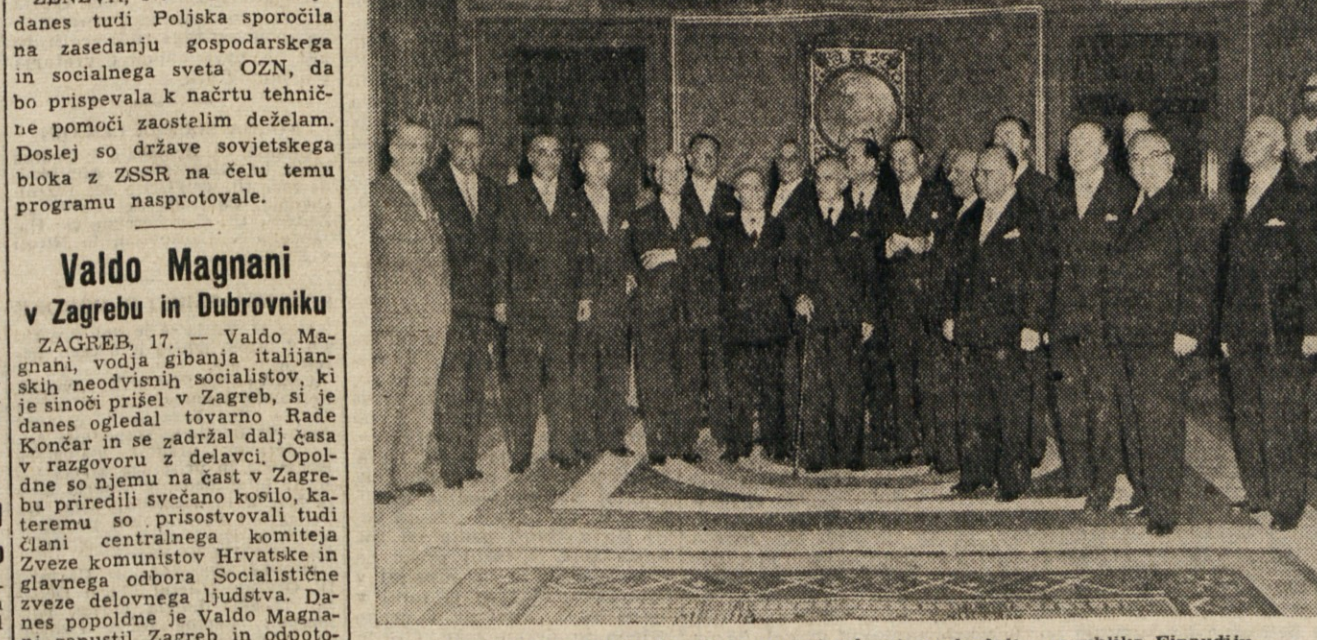
Člani nove italijanske vlade po prisegi pri predsedniku republike Einaudiu.

List zaključuje, da gre vsekakor za ogorčeno borbo za oblast v ZSSR, v kateri igrajo zunanje politična vprašanja podrejeno vlogo. Današnja moskovska 'Pravda' poroča, da je bilo ustanovljeno sovjetsko ministristvo za