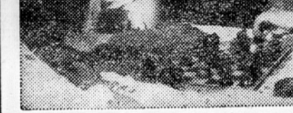
Po delu pa še malo razvedrila in šahovske borbe...

V terek so imeli novi delavci svoj prvi sestanek. Zbrali so se v veliki menzi na Straži. Govoril je predsednik sindikalne podružnice in posamezni referenti. Pazljivo so jih novi delavci poslušali. Referent za zaščito dela in socialno skrbstvo jim je prikazal pomen delavca v socialistični Jugoslaviji kako so kapitalisti izkoriščali delavce v stari Jugoslaviji itd. Nato pa so se delavci pogovorili o preskrbi, ki so jo vsi pohvalili, o rdečem kotičku, ki ga bodo še ta teden uredili in o delu v tovarni. Nato pa je zapel pevski zbor kovinarjev. Med starejšimi delavci in udarniki ter delavci-novinci se je razvil živahen pogovor. Več novih delavcev je ta večer sklenilo, da za vedno ostanejo na delu v jeseniški železarni. — B. K.