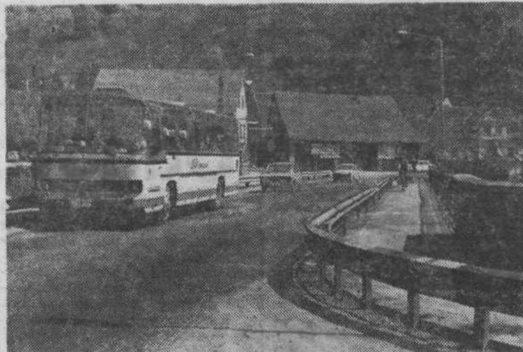
2. Karlovški most je nedvomno najbolj razvpiit prometni zamašek in ne brez vzroka. Predvsem ob nedeljah in zadnje dni praznikov se na obe strani vijejo nepregledne kolone motoriziranih turistov. Tovariši v modrih uniformah so celo začasno uvedli enosmerni promet, a menda ni zadovoljivo učinkovit.