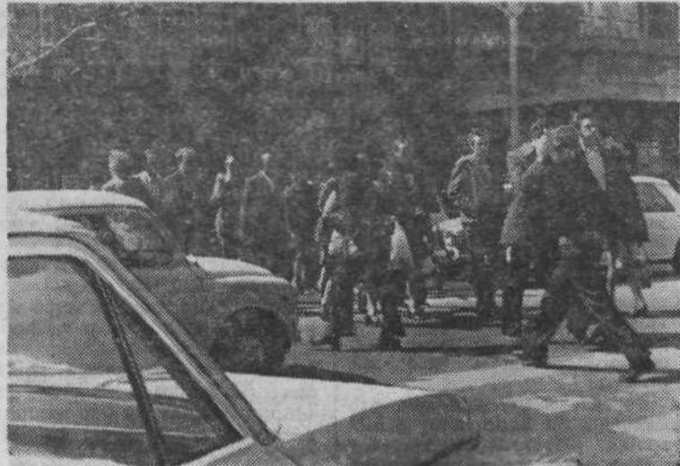
1. Na Titovi cesti ob Viatorju je prehod, ki velja za enega najnevarnejših v Ljubljani. Tik pred prehodom je namreč avtobusno postajališče, tako da je nepregledno za pešce in voznike. Na tem mestu bodo postavili semafor.

Pogosto zaidemo v škarje ali »zamaške«. Nevarnost preži tam, kjer jo pogosto najmanj pričakujemo. Naslednje slike pa nam kažejo, kje je nenehna nevarnost.