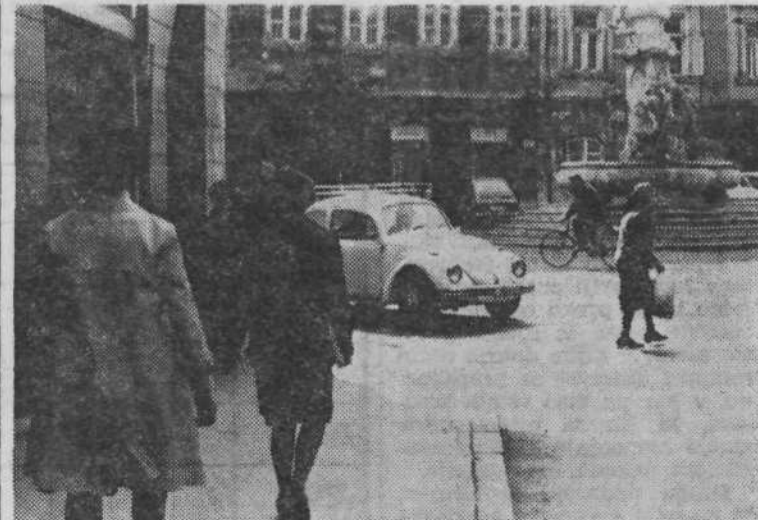
4. Tudi ob Magistratu je nepremišljeno izbran prehod. Zebra je zarisana tik za nepreglednim ovinkom. Le trenutek zamišljenosti in nesreča je tu. Izrečen je bil tudi predlog, naj bi naredili zebro preko celotnega ovinka, podobno kot pred Namo.