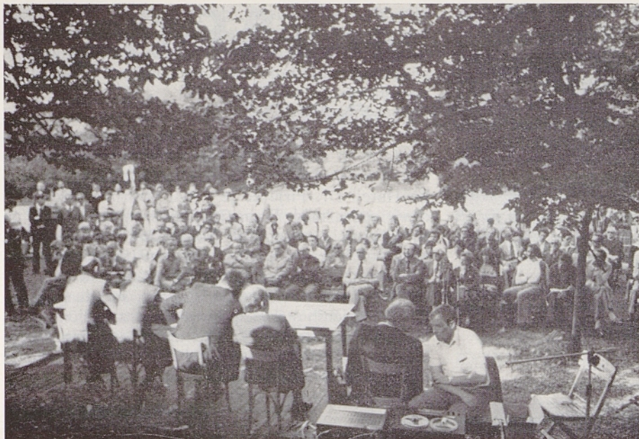
Draga 78: med okroglo mizo v nedeljo popoldne