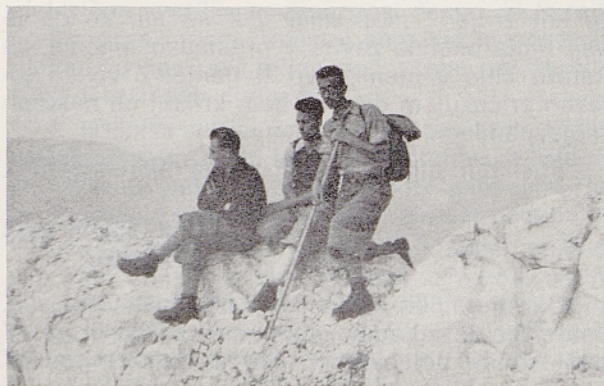
Pesem na hrbtni strani fotografije:

Pri dekletih sem začel zadnja leta razlikovati med tisto izobraženostjo, ki je le neko znanje, in pa med plemenitostjo duše. Sicer pa dobiš tudi na kmetih dekleta, ki so izobražena — živela