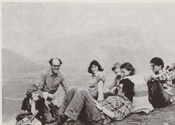
Zaslужeni počitek na vrhu Ojsternika

Priložnost za tako poglobitev odnosov je letos svojim članom dala mladinska organizacija Slovenski kulturni klub,