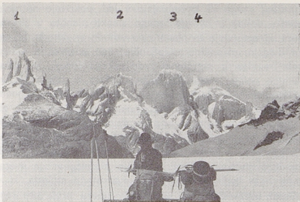
Pogled s «kontinentalnega ledu» na gore, ki mejijo na vzhodu ledeno planoto: 1. Fitz Roy, 2. Pillone, 3. Pierr Giorgio, 4. Torre