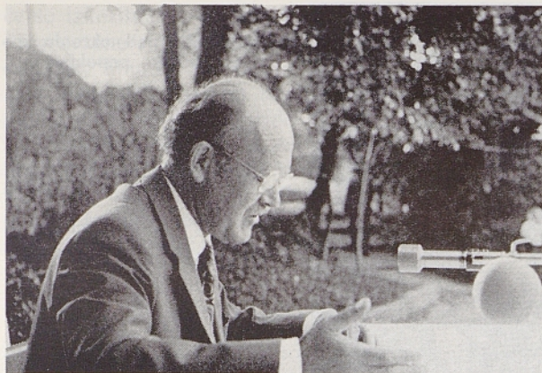
Dr. France Bučar

Bučar. Obravnaval je temo »Ideologija in demokracija«. Jedro njegovih ugotovitev je spoznanje, da ideologije hromijo demokracijo, zlasti kadar postanejo orodje in preteva za oblast. Predavatelj se ni spuščal na raven politične konkretosti, ampak je ves čas ostal na visokem znanstvenem nivoju, kar je dalo večeru in celotni Dragi naravnost vrhunski ton. Popoln užitek bo branje zahtevnega predavanja, ko bo izšlo še v tisku.