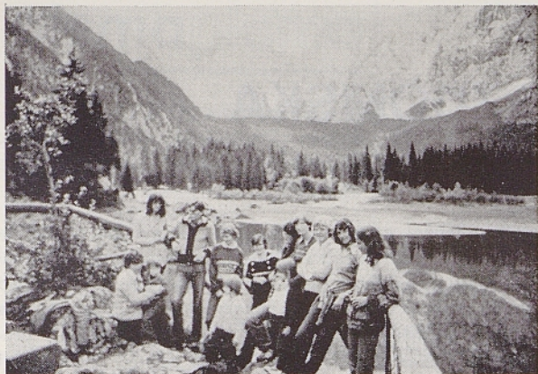
Pri zgornjem Belopeškem jezeru

jatelji z eno samo željo: da bi se čimprej spet srečali v Trstu in da bi kmalu spet lahko organizirali podobno letovanje.