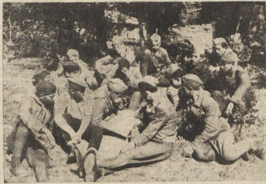
Borci JA ne vadijo samo z orožjem, marveč širijo svoje znanje tudi s čitanjem knjig in časopisov.

tanjih, v Cakovi in v Dokležovju. Ponekod so se vrinili v zadruge elemente, ki so si hoteli porazdeliti gradbeni material zase. Zadruga so prejele 790.000 din kreditov. Vrednost kreditov pa se je zvišala s prostovoljnimi delom. Tako znaša samo pri petanjski zadrugi vrednost prostovoljnega dela do 500.000 din. Murskosoboški zidarji in tesarji so pomagali samo v petanjski zadrugi zgraditi trinajst hiš.