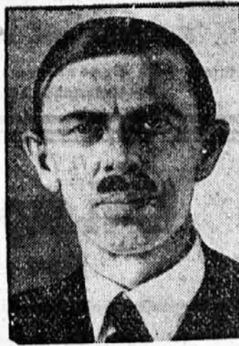
Ljubljana, 27. maja 1943.