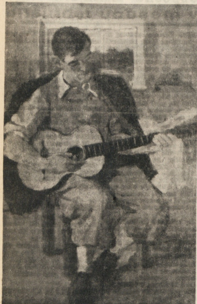
Mož s kitaro.