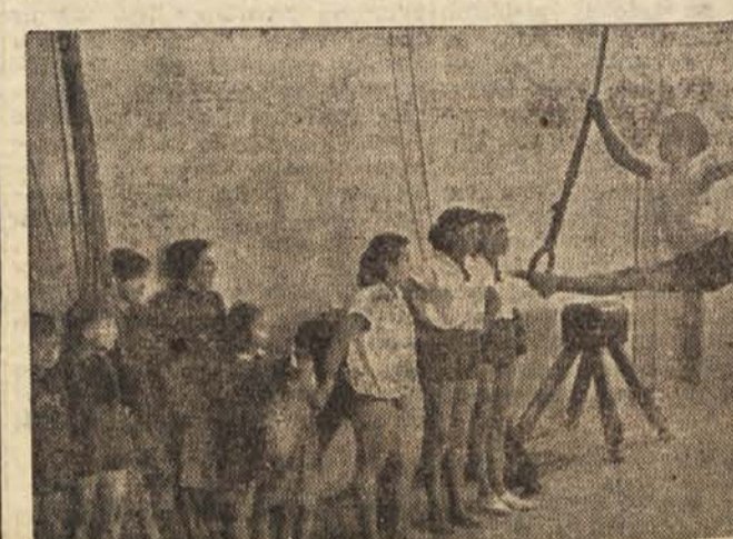
V novi telovadnici Partizana Zali hrib

Povratna tekma bo marca prihodnjega leta v Budimpešti.