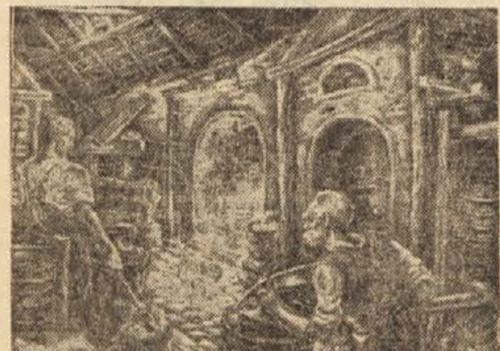
Gvidon Birolla: Stara kovačija, kovanje kos, 1909