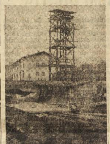
Poleg novega 9-stanovanjskega bloka Jugotainina zidajo novo stanovanjsko hišo, ki jo investira LO MO Sevnica

osnovne organizacije mora dnevno uredničevati organizacijske naloge SZDL, ki pa same sebi niso namen. Naša hitra socialistična rast nam daje vsak dan nove naloge, ki jih je treba sproti tolmáčiti in ne dopuščati, da jih po svoje razlagajo nergači in posamezni nasprotniki. Pri tem morajo občinski odbori pravilno razporejati sile, s katerimi razpolagajo, in poznati sposobnosti odbornikov in članov, ki s tem delu lahko najuspešneje pomagajo. Naloga odborov osnovnih organizacij Socialistične zveze je torej, da organizirajo tolmáčenje ukrepov naših organov, problemov in vseh vprašanj, ki zanimajo naše človeške ljudi. Na seji so se pogovorili tudi o najnujnejših potrebah kulturnega doma Svobode na Vidmu in o predavanjih, katere naj bi spet imela Ljudska univerza. Sklenili so, da bodo organizirali poseben razgovor o kmečki proizvodnji in vprašanih, ki so najaktualnejša za vas; odborniki vaških organizacij želijo, da bi občinski odbor pripravil tak razgovor, na katerem bi sodelovali razen strokovnjakov tudi politični delavci, nekje na vasi, da bi se ga udeležili tudi kmetje, člani Socialistične zveze