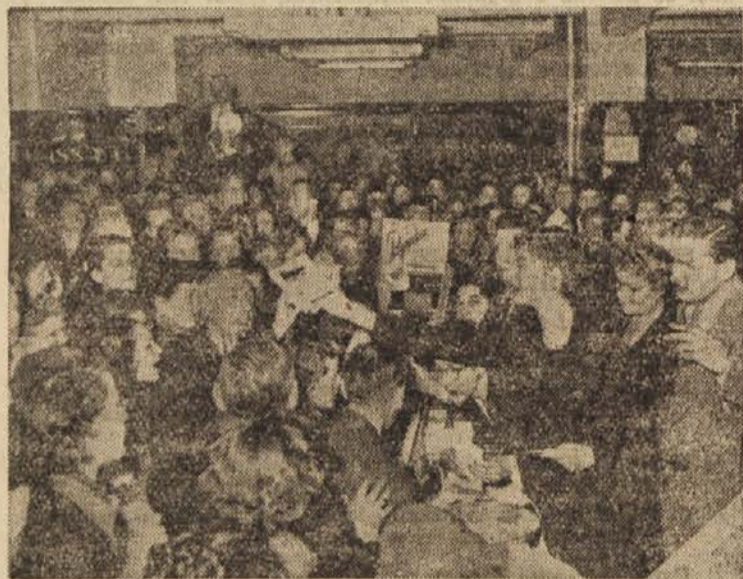
Znana filmska igralka Audrey Hepburn je te dni — kmalu potem ko je razočarala svoje oboževalce z nenadno poroko — presenčila prebivalce Amsterdama in za nekaj ur prevzela vlogo prodajalke v neki veleblagovnici. Za koga je bilo to večja reklama — zanjo ali za veleblagovnico?

Uredništvo »Samedi Soir« je potem objavilo pojasnilo, da nameren poskusa ni bil osmešiti očividce čudnih pojavov, marveč samo dokazati, kako bujno domišljijo imajo ljudje in kako nezanesljivo je pripovedovanje očividcev raznih »nenaravnih« pojavov.