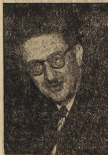
Jules Moch, francoski delegat v OZN

Sovjetski delegat A. Višinski je izjavil, da se predlog o ustanovitvi mednarodne agencije za atomsko energijo Sovjetski zvezi ne zdi dovolj izdelan, da bi se lahko zdaj izrekla o njem.