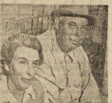
Jean Renoir in scenaristka filma »Reka« Rumer Godden

Ko so se nato skupno z mnogimi francoskimi filmskimi ustvarjalci umaknili pred Nemci v Hollywood, se je pravzaprav zaključilo njegovo pravo umetniško delo, kajti tu je kot n. pr. Clair izdelal le nekaj povprečnih filmov, od katerih sta pomembnejša le dva, in sicer 'Močvirje' in pa 'Človek z jugs'.