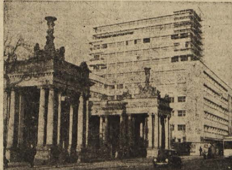
Tiskovno središče v Berlinu