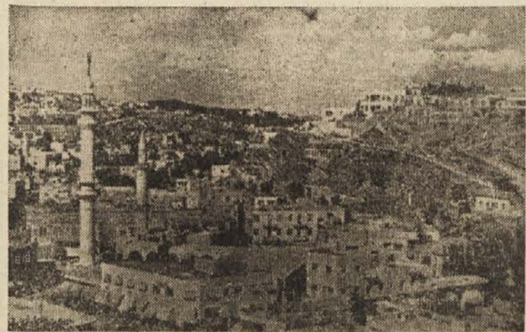
Aman — glavno mesto Jordana

rem uporabljajo domala svetopisemsko orodje, je glavni vir dohodkov prebivalstva te dežele. Živinorejo se ukvarjajo beduinjska plemena, ki na obsežnih puščavskih planjavah pasejo živino in se neprestano bore za goli obstoj. Njihovo življenje se v zlic stikom s civilizacijo ni mnogo spremenilo, marveč je ostalo takšno, kakršno je bilo pred mnogimi stoletji.