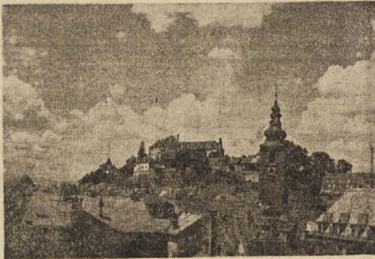
Ptuj, staro zgodovinsko mestec ob Dravi, hrani prenekatero zanimivost. Potnik, ki ga obišče, si z veseljem ogleda grad z muzejem

V KZ in Kmetijskem gospodarstvu St. Jurij pri Celju, so uporabljali regresirano pogonsko gorivo za prevoze s traktorji raznim podjetjem, za žaganje drv itd. Uporabljeno gorivo so zaračunali po normalnih prodajnih cenah in si tako ustvarili neupravičene dohodke. Kmetijska zadruga v Kozjem, je porabila ali prodala 2833 kilogramov benzina in nafte za razne prevoze in žaganje drv. Za to so prejeli 106.665 din regresa. Ponekod še niso ugotovili, koliko so se okoristili z regresi.