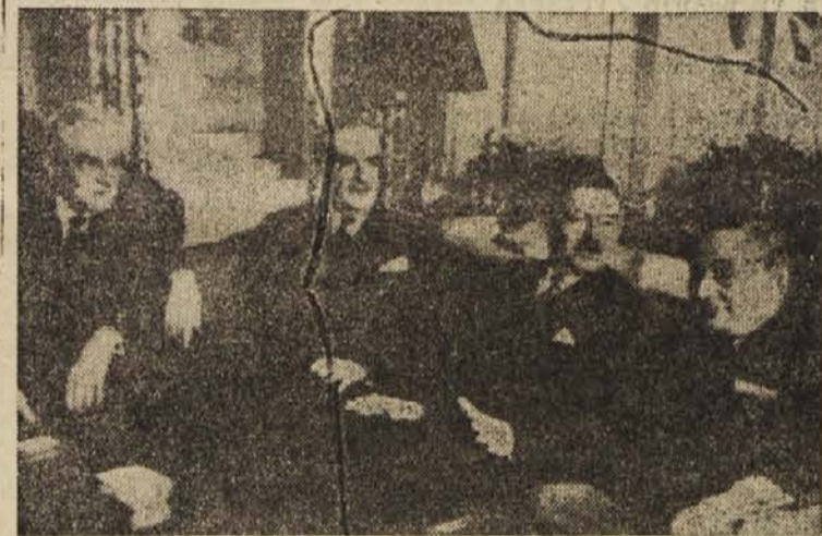
Dulles, Eden, Figl in Bidault

bodi na ljubo. Mi ne moremo privoliti v žrtve, če bomo vzlic temu živeli še nadalje brez svobode. Glede tega ni možen kompromis. Ko je odgovarjal na vprašanje novinarjev, je Figl zatem dejal, da Avstrija ne more privoliti celo