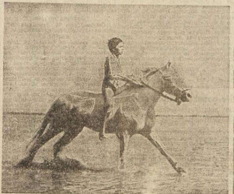
Prizor iz filma »Bela griva«