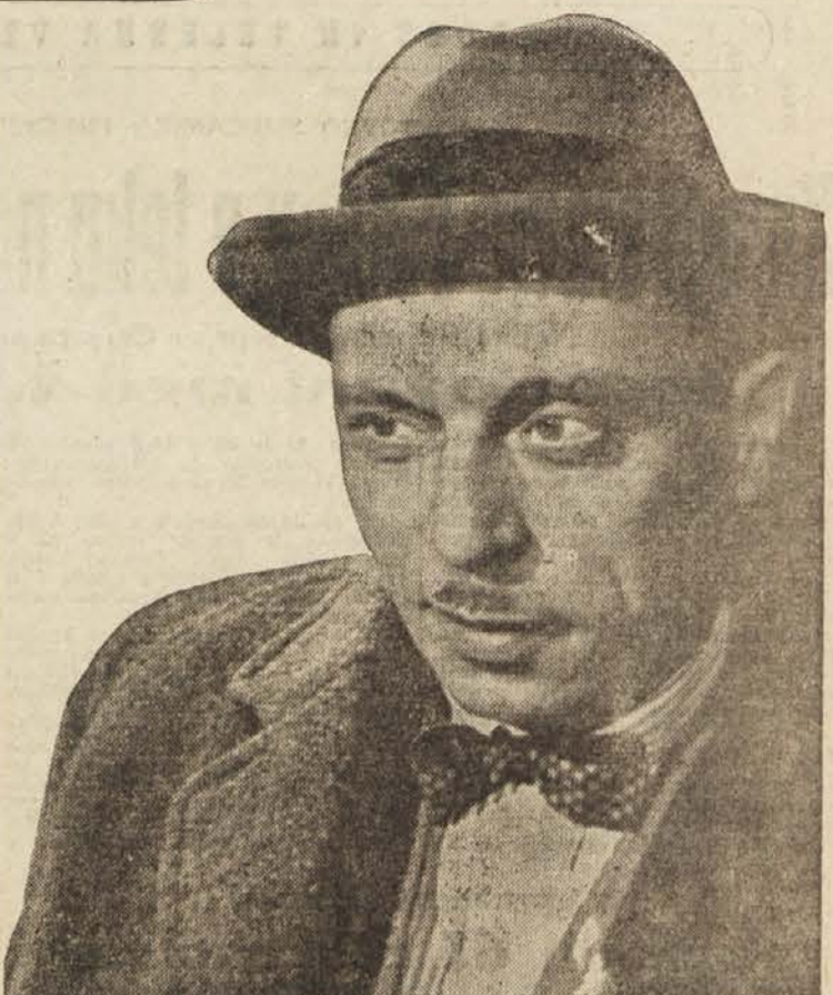
Nagrada slika III. Povejte, kdo je ta umetnik. Našajte nekaj filmov, v katerih ste ga videli igrati.