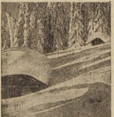
Koča v snegu

Letos nameravajo tlakovati trboveljsko cesto na odseku od rudniške restavracije do Sušnika. V soboto je gledališka družina Svobode Center uprizorila Klubundovo dramo »Krog s kreda«. Delo je režiral Mitko Rak.