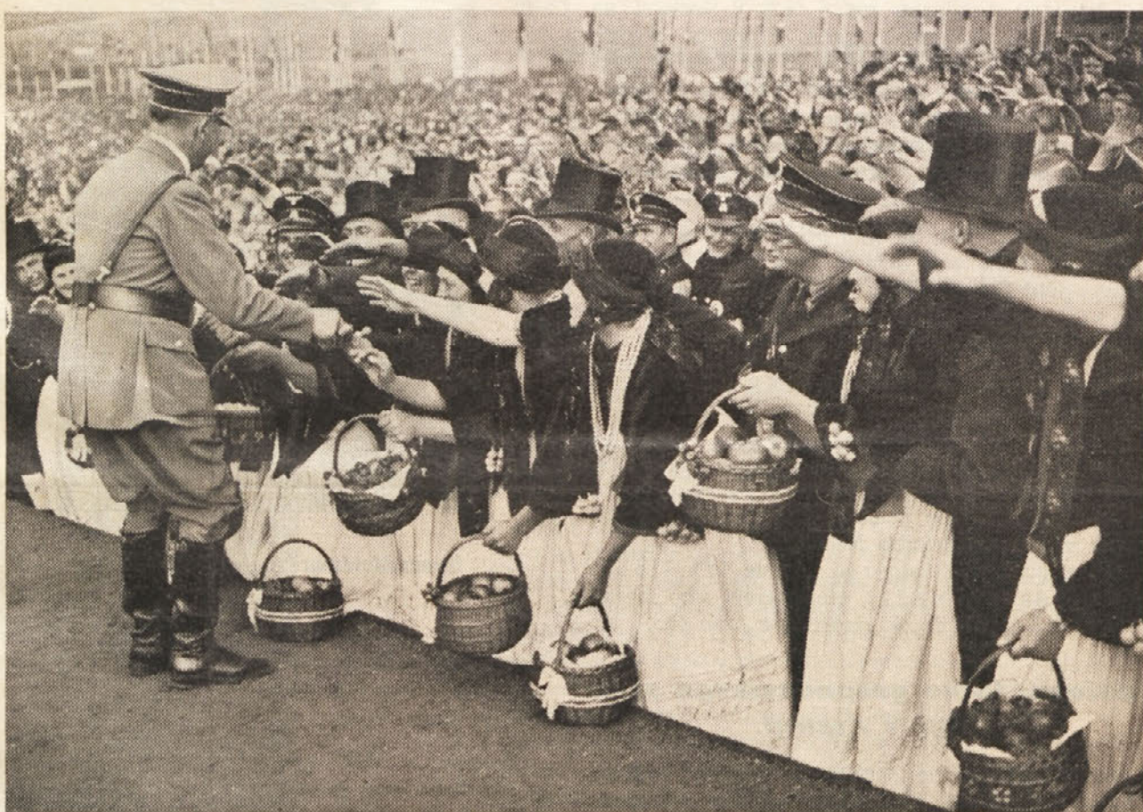
Podeželsko ljudstvo prinaša Führer-ju svoje pridelke v dar in mu solznih oči hvaležno stiska roko.