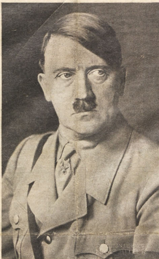
Führer in kancler Velike Nemčije Adolf Hitler.

Opomba: Glasuje se na ta način, da se v krog pod besedico „Ja“ začrta križ.