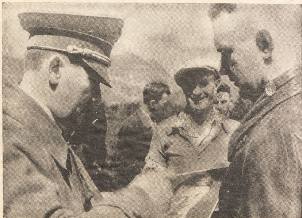
Prosil je Führer-ja za podpis in ga dobil. Tega trenutka v svojem življenju ne bo pozabil.