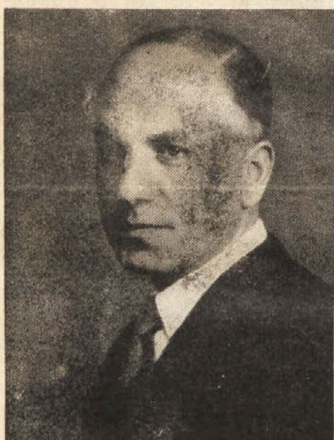
Stvaritelj modernih nemških avtomobilskih cest: dr. Fritz Todt.