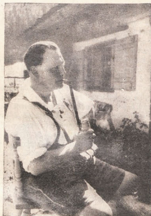
Generalfeldmaršal Göring po truda- polnem delu na oddihu v gorah.