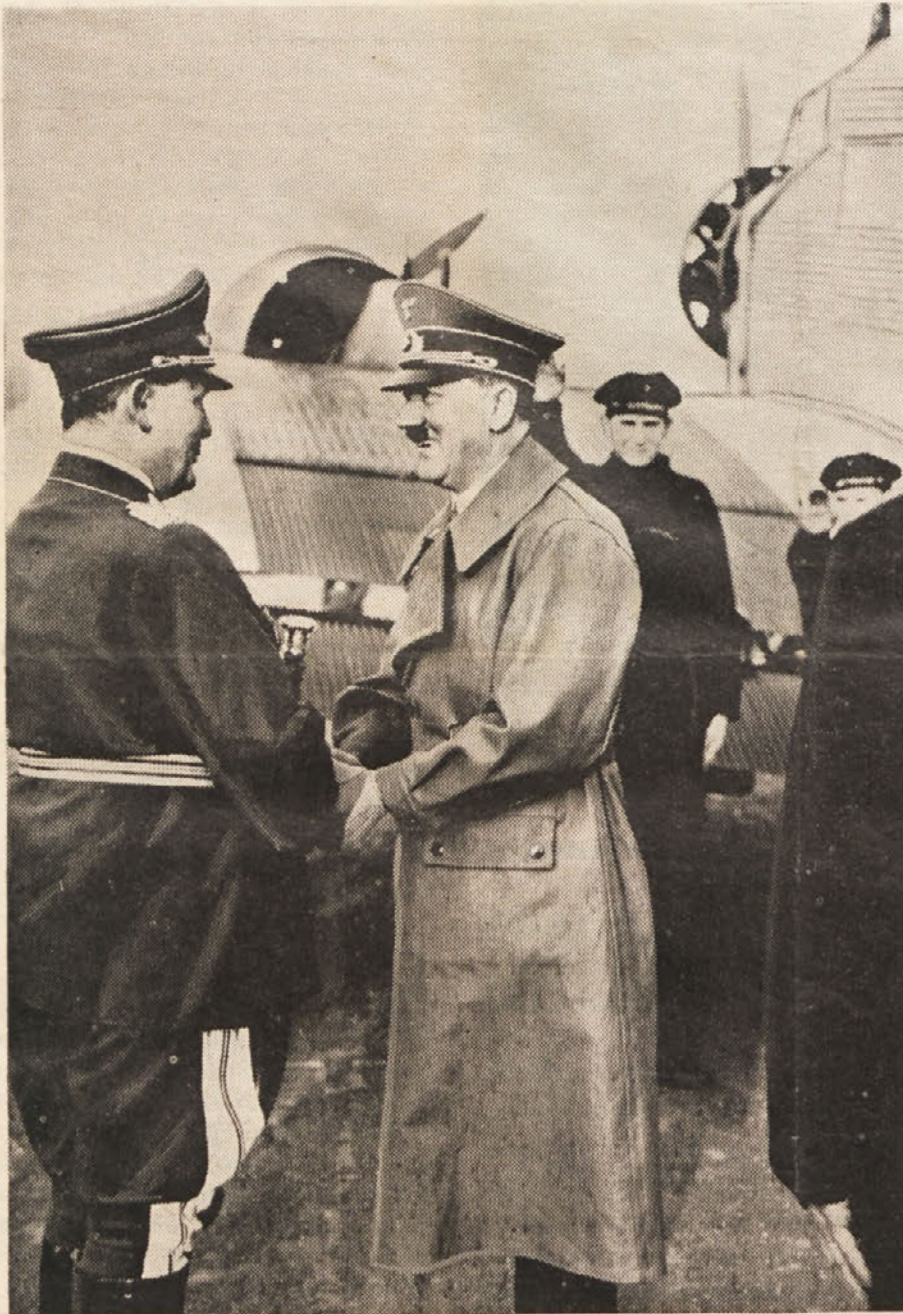
Führer-ja, došlega s triumfalnega potovanja v Avstriji, pozdravlja kot prvi na berlinskem letališču generalfeldmaršal Göring.

Kjerkoli so prej s štrajki na eni in z izključitvami na drugi strani motili delovni mir in uničevali delovni uspeh, tam vlada danes blagoslov družinobrata in notranjega miru, v katerih znamenju se nemški delavec prosto razvija.