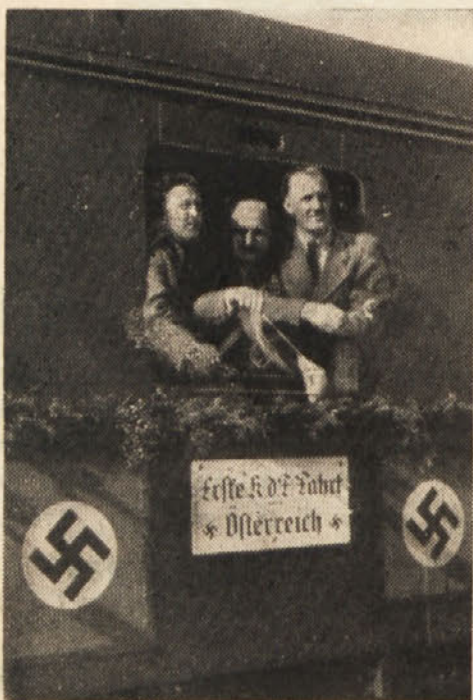
Avstrijski delavci na vožnji skozi rajh. Minule dni je posetilo rajh nad 10.000 avstrijskih delavcev. Ljudstvo jih je sprejemalo z velikanskim navdušenjem.