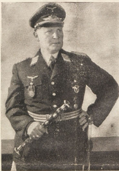
Generalfeldmaršal Hermann Göring.

7. Enako važno je, da se dvignejo avstrijski naravni zakladi. Tudi so že stopile v veljavo odredbe. Takoj se izgradi in zviša proizvodnja podjetja Alpine Montan do dvakratnega obsega. Takoj se nastavi 500 delavcev in pozneje še nadaljnih 1000 delavcev. Takoj se preiščejo možnosti, kje se še nahaja železna ruda, in sicer bo to storilo podjetje Hermann Göring. Velike železarne, ki smo jih nameravali zgraditi v Franken-u, bodo zgrajene v Lincu in bodo najmodernejše podjetje, ki je bilo doslej zgrajeno. To spet