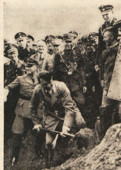
Führer zasadi prvič lopato v zemljo pri gradnji državne avto-železnice. Nemčija je danes v pogledu modernega cestnega omrežja prva na svetu.

Kdor spoštuje dediščino svojih prednikov, spoštuje sebe!