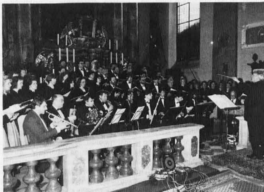
Koroški izvajalci Reke mojega življenja

V soboto, 12. junija 1993, ob 20.30 v župnijski cerkvi v Štandrežu