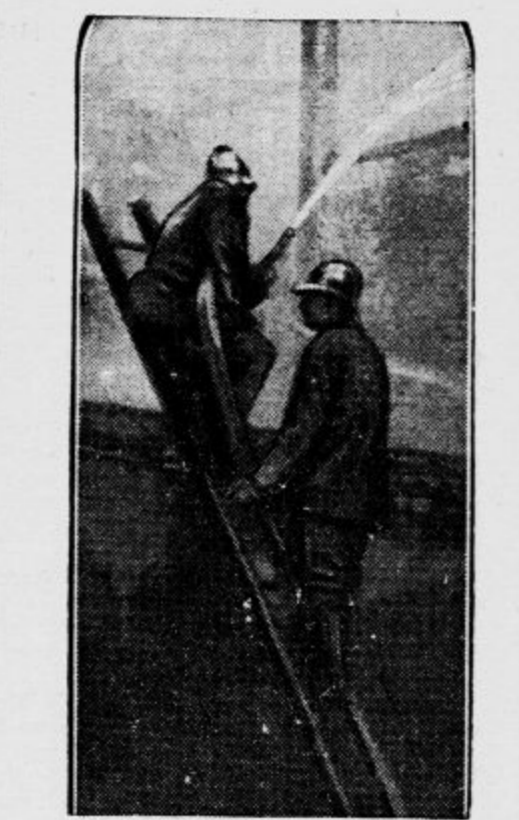
Težka požarna katastrofa v Parizu

Seveda je bil rimski jedilnik primeren izbircnosti tistih, ki so ga sestavljali. Ko so bili bogatini vsega siti, so si naročili eksotične jedi, n. pr.: možgane ptičev plamencev, pavov in papig ter jezike ptičevpevcev. In na koncu so si s poseganjem v goltanec praznili želodce.