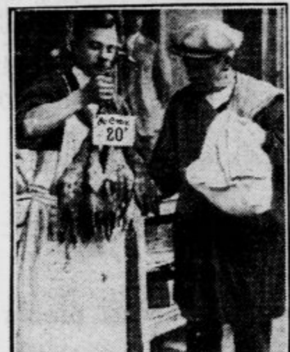
Malo in drago

Pojedine starih Rimljanov Če primerjamo naše bankete z gostijami starih Rimljanov, moramo reči, da se izlepa ne najdejo požeruhi, ki bi delali čast njihovim nenasitnosti. Vsak povprečen Rimljan je jedel po večkrat na dan, in sicer obilnejše kakor današnji prav imovite rodbine. Zajtrk, obed in večerja je obsegal vedno po več jedi hkrati. Začetek je bil nekakšen »hors d'oeuvre« in je sestojal iz rib, jajec in pikantno kislih jedi, ki dražijo apetit. Glavni obrok se je imenoval »pugna« in je bil v resnici pravcata bitka, v kateri ni junak nikdar odpovedal. Kuharji so prinesli na mizo cele živali, katere so gladeži tesali po mili volji. Vsak sladokusec je prišel tukaj na svoj račun. Prvi je vzel nogo, drugi glavo ali vrat, tretji rebra itd. K večjim živalim so se servirale še manjše. Potem so ponujali desert, močnate jedi, sir, sadje in drugo. Slovit Lukul, ki se po njem še danes imenujejo razkošne pojedine, je potrošil samo za eno kosilo ali večerjo do pol milijona dinarjev današnjega