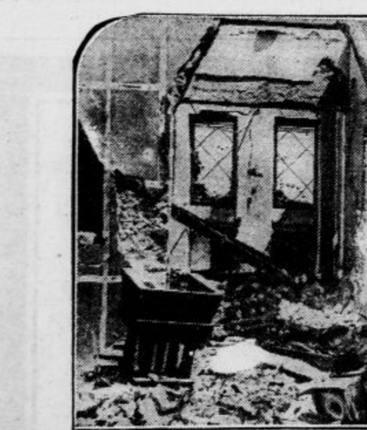
K nemirom v Palestini Židovska hiša v Meher Hajelu, ki so jo razdelali in zažgali arabski demonstranti.

Jesen in zima sta nam vsem prijetna, če smo v elegantnih toplih ulstrijh in suknjah. Segajmo po najboljših. Suknje in blago v številnih modernih uzorcih samo pri tvrdki Drago Schwab, Ljubljana