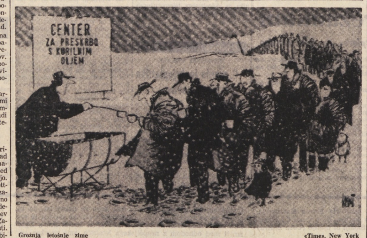
Grožnja letošnje zime «Times, New York

Nekateri so kot nori zdrveli v protiatomske zaklone, drugi pa so neprenehoma telefonirali policiji in uredništvom krajevnih listov ter spraševali, kaj jim je storiti. Oblasti so morale prekriti mladinsko oddajo in zagotoviti, da so poslušalci slabo razumeli namen oddaje, da so spet vzpostavili red v mestu. Je omogočilo aretacijo De Marchija in ostalih. Genovska prevratniška celica je imela podrobno izdelan načrt za državni udar, ki naj bi se začel z likvidacijo vidnih političnih in drugih predstavnikov demokratičnih sil. Ob tem pa se postavlja vprašanje, če bi bila bojzavljiva Porta Casucci in od