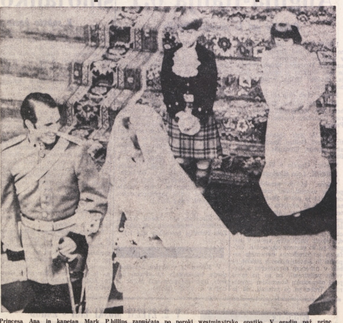
Princesa Ana in kapetan Mark Phillips zapuščata po poroki westminstrsko opatijo. V ozadju paž princ Edvard in častna spremljevalka lady Sarah Armstrong Jones

LONDON, 14. — Z eno najbolj razkošnih porok v človeški zgodovini sta si britanska princesa Ana in stotnik Mark Phillips obljubila večno zvestobo v westminstrski katedrali. Svečanosti, ki jo je BBC prenašala v barvah, je sledilo okrog pol milijarde ljudi na televizijskih zaslonih vsega sveta. Angleži, ki se redkokdaj raznežijo, so kar ponoreli za svetlosto in bledo princeso, ki se je omožila z briljantnim častnikom v razkošnem okviru westminstrske katedrale, kjer si je doslej obljubilo večno zvestobo le deset kraljevskih parov. Prvi dve poroki sta bili med 12. in 13. stoletjem, naslednja šest stoletij pozneje, zadnje tri pred Anno pa so bile leta 1947, ko se je sestanek kraljica Elizabeta omožila s princem Filipom Edimburškim. Leta 1960, ko sta se poročila princesa Margaret in Anthony Armstrong Jones in leta 1963, ko se je omožila grofica Aleksandra Kentska.