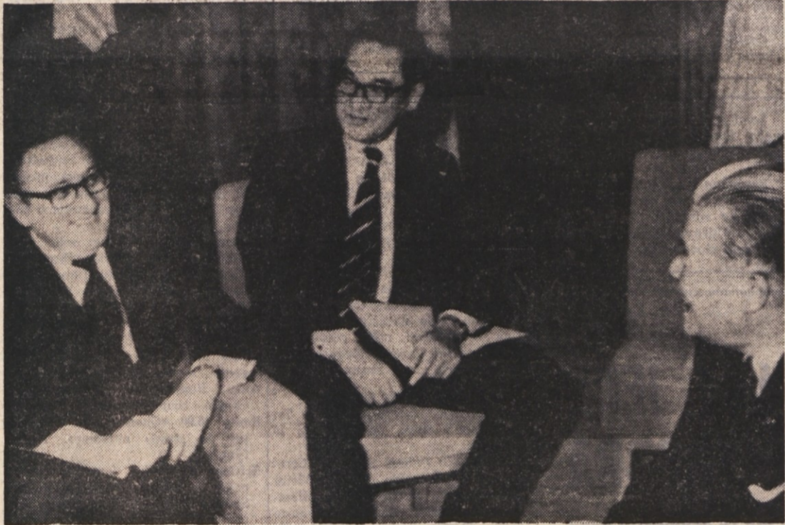
Ameriški in japonski zunanji minister Kissinger in Ohira med svojim večerašnjim pogovorom

TOKIO, 14. — Danes zjutraj je prispel v japonsko glavno mesto ameriški zunanji minister Henry Kissinger, ki se bo ustabil v Japonski dva dni.