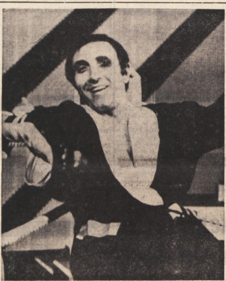
Res je, da je vodstvo italijanske RAI - TV nekoliko omejilo izdatke. Ta omejitve se kaže že na vsakem programu, seveda na njegovi kakovosti.

Po Platonu je otok Santorino bil sestavni del Atlantide - Tudi nekateri sodobni arheologi se opredeljujejo za to tezo - Odkritja prazgodovinskih mest