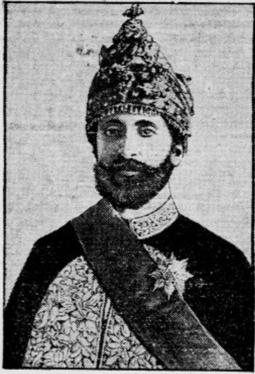
Cesar Haile Selasie

Srednjeveške kazni: sekanje rok in ušes — Teren, najhujši nasprotnik sovražne invazije — Z letali in tanki ni v Afriki nič