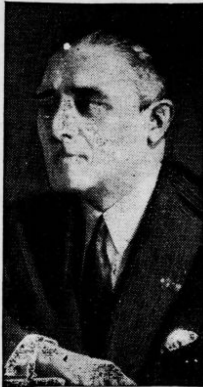
Italijanski poslanik v Abesiniji, graf Vincini

njegovemu položaju. Ni dvoma, da se bo črni kralj do skrajnih mej boril proti italijanskemu poseganju po zemlji svoje države. Zato bo drama, ki se bo v kratkem začela odigravati na črnem kontinentu zanimiva za ves svet.