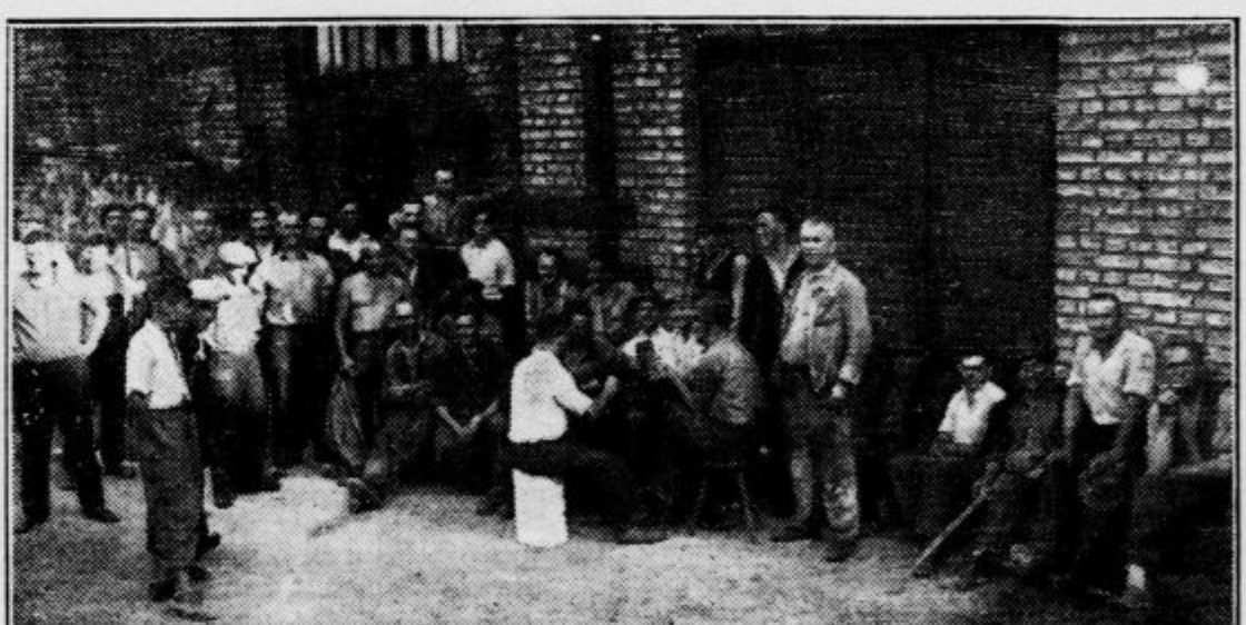
V tovarniških prostorih stavkujoča skupina jeseniških kovinarjev. Posadke treh šhtov hočejo ostati v tovarni, dokler se ne zaključijo pogajanja med podjetjem in zaupniki