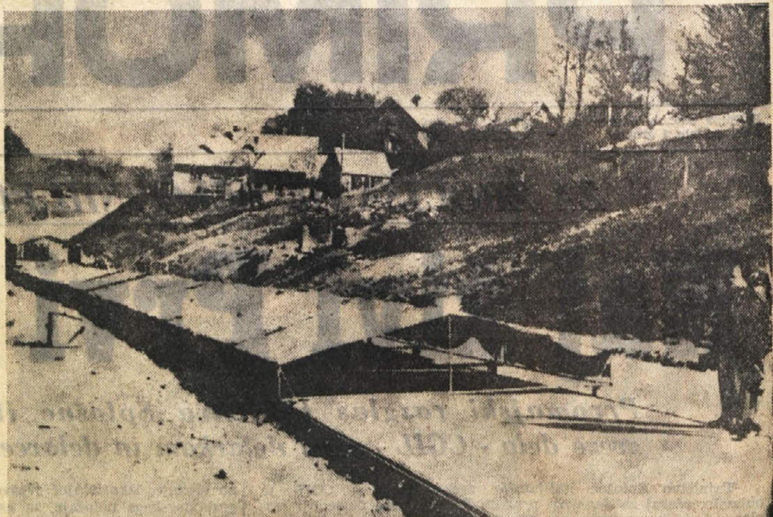
Na Gorenjskem spet betonirajo na novi cesti, ki bo presekala ovinkate okrog nerodnega brezjanskega klanca. Mogoče se homo lahko že kmalu pejal na Bled po tej cesti ter se tako izognili tistemu odseku, ki res ni bil več primeren za današnji čas in promet.