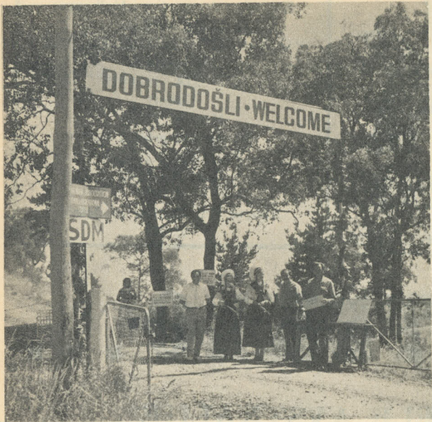
Levo: Velik napis "Dobrodošli" in naša mladina v narodnih nošah so sprejemali prišlece pri vhodu na naš hrib.