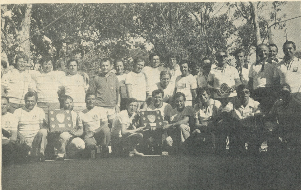
Levo: Skupna slika udeležencev balinarskega tekmovanja ob priliki proslave 20-letnice.