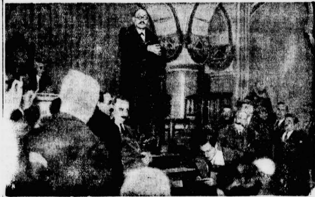
Renauel, der Führer der ausgeschlossenen Neuzozialisten spricht in der ersten Geheimversammlung der neugebildeten Partei in Paris.

Die Neuzozialisten, deren Führer aus der alten Partei ausgeschlossen wurden, weil sie sich nach dem französischen Sozialistenführer Jean Renaudel nennen soll.