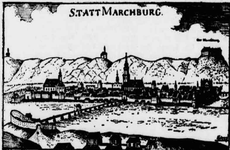
Die Draufstadt im 17. Jahrhundert.