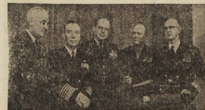
V Pentagonu, v državi Washington, so se dali skupaj fotografirati šefi vseh ameriških štabov. Od leve proti desni: šef štaba ameriškega letalstva general Nathan Twining, šef štaba ameriške vojne mornarice admiral Arthur Radford, šef štaba ameriške kopnene vojske general Mathew Ridgway, komandant mornariških čet general Lemuel Shepherd in šef pomorskih operacij admiral Robert Carney

nite naočnike ali pa vzemite povečevalno steklo. Tu imate uro, ki sem jo kupil pri vas pred dobrim tednom. Ne pozabite, da sem jo kupil z garancijo. Samo enkrat mi je med delom padla na tla in tu imate zdaj posledice. Zdaj pa bi rad vedel, kaj je z vašo garancijo? Ali boste svojo obljubo izpolnili ali ne?« »Trenutek, prosim. Pravite, da vam je ura padla med delom na tla? To je izključeno. Morali ste jo položiti na nakovalno in udariti po njej s kovaškim kladivom, da ste jo tako zdelali.« »Nič se ne izmikajte. Če vam pravim, da mi je padla med delom na tla, že vem, kaj govorim. Ko sem pokrival streho cerkvenega zvonika — sem namreč krovec — in ko sva s tovarišem delala prav na vrhu — zvonik je visok komaj devetdeset metrov — mi je zdrsula ura iz žepa in padla na tlak. Dobro ura sva s tovarišem iskala, preden sva našla vse raztresene dele. No, zdaj pa povejte, kako je z vašo imenitno garancijo?«