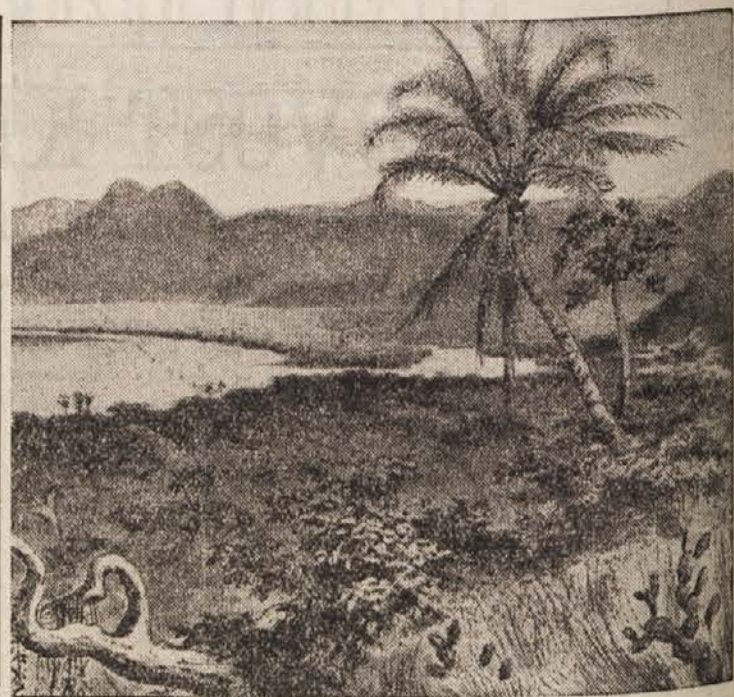
Haiti drugi največji otok Antilov.

Haiti je bil neodvisen. Nad mogočnimi palmami je vihrala na tropičnem otoku modro-rdeča zastava. Sledila pa so burna leta uporov, vstaj, spletk, izdajalstva, mučenja, junaštva in obupa. Haitija je sklenil zvezo s Španijo, doživel invazijo Angležev in jih spet pregnal. Imel je cesarja in kralja ter več predsednikov. Mnogi so umrli nasilne smrti. Zadnjega zločinskega predsednika Guillaume Sama je ogorčena množica leta 1915 raztrgala na kose, ker je dal poklati 150 ujetnikov, večinoma članov najuglednejših družin. Potem pa so Američani zasedli to deželo in napravili red. Zdaj je Haitija spet svoboden in skuša navezati stike s civiliziranim svetom.