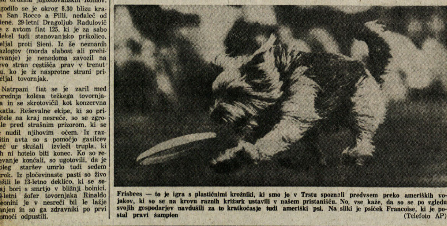
Frisbees — to je igra s plastičnimi krožniki, ki smo jo v Trstu spoznali predvsem preko ameriških vojakov, ki so se na krovu raznih križark ustavili v našem pristanišču. No, vse kaže, da so se po zgledu svojih gospodarjev navdušili za to kratkočasje tudi ameriški psi. Na sliki je psiček Francoise, ki je postal prvi šampion