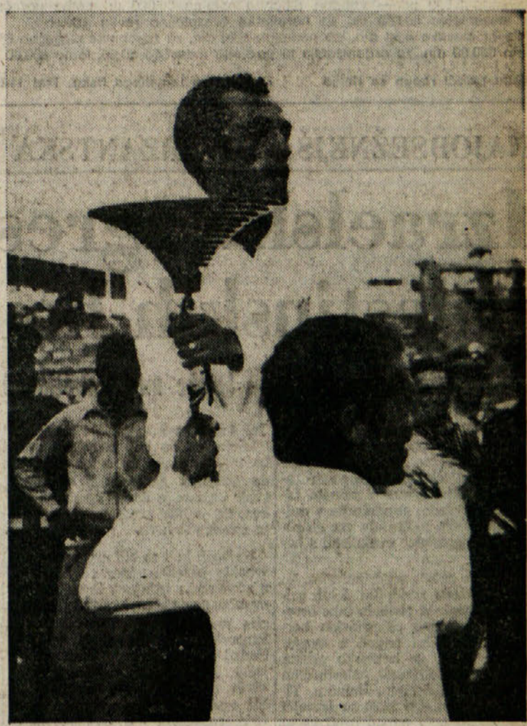
Pietro Mennea prejema nagrado v Barletti za velike uspehe v slajni atletski karieri