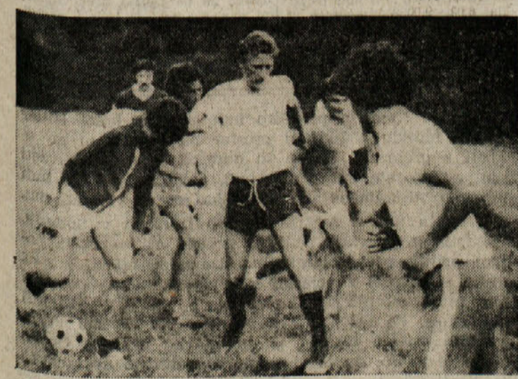
Krasovi nogometaši med treningom

Tudi za nogometne amatere se končujejo počitnice. Po dveh mesecih odmora v teh dneh je na raznih igriščih vse živo. Mnoge ekipe so se že lotile s pripravami, druge pa bodo to storile v teh dneh. Kot običajno, se tudi letos v tem obdobju o nogometu marsikaj govori. Navijači postajajo zahtevnejši in zato voditelji klubov jim hočejo ustreči. Obljub seveda ne manjka, vendar je težko vsem ugoditi, saj se vsa društva ubadajo s finančnimi težavami. Res je, da govorimo o amaterskem nogometu, vendar se v pogovoru z voditelji raznih klubov slisi o vsotah s šestimi ničlami za nogometaši, ki igra v 3. oziroma 2. amaterski ligi.