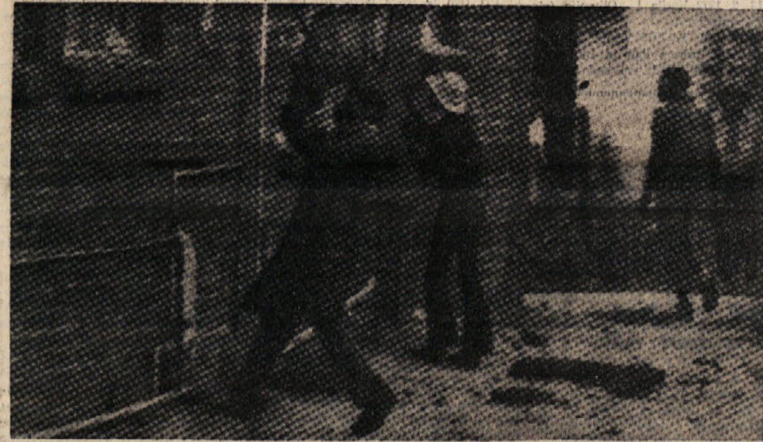
Demonstracije v Gwelu: ogorčeni črnici razbijajo javne lokale belih gospodarjev

ATENE, 20. — Zelo močno neurje je včeraj ponoči opustošilo grško obalo. V sami prestolnici so pristojni organi sprejeli več kot 4.000 klicev na pomoč zaradi poplave, ki jo je povzročilo deževje. V Korintu pogrešajo enajst ljudi, ki jih je morje odplavilo z obale, v Patrasu pa so velikanski valovi odplavili mlado dekle. To mesto, ki je glavno pristanišče za ladje, ki povezujejo Grčijo z Italijo, je utrpelo hudo škodo. Neurje je porušilo številne hiše in podrla drogeve električne in telefonske napeljave.