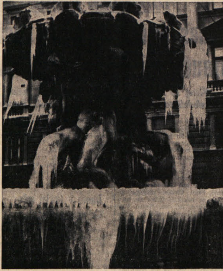
V dneh, ko je led oklepal vodomet pred glavno pošto