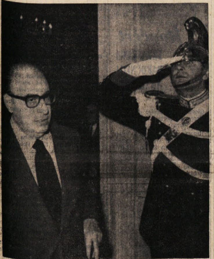
Posl. Mancini po posvetovanju s predsednikom republike zapuša njegov urad.