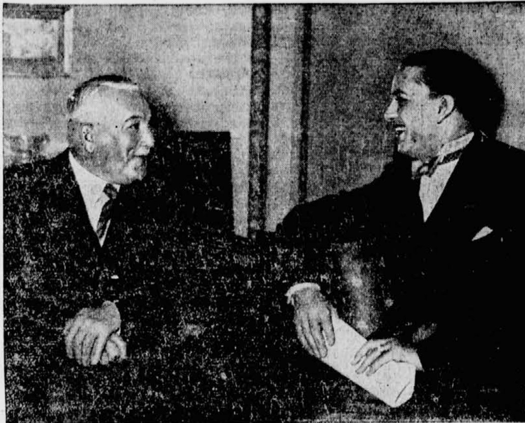
Am Mittwochmittag fand die erste offizielle Besprechung zwischen dem italienischen Außenminister Graf Ciano (rechts) und dem Reichsaußenminister v. Neurath (links) im Auswärtigen Amt statt.