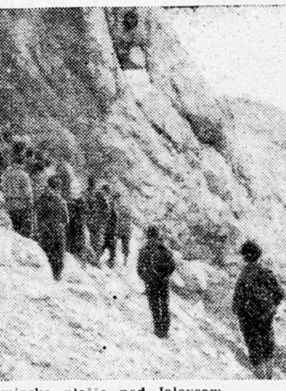
Odkritje spominske plošče pod Jalovcem

Kmalu bo minilo leto od ustanovitve PD Univerza. Obračun doseganega dela bo družstvo podalo na običnem zboru četrte ob 19.30 v velik predavalnici na Grabnu. Tu se bodo člani pogovorili tudi o svojem bodočem delu. Če pogledamo rezultate dosedanje dejavnosti, vidimo, da je družstvo v tem času imelo precej uspehov. Od 500 študentov, vpisanih v soiskem letu 1949-1950, je bilo v Planinskem društvu vključenih 2693, kar znaša 50% vseh študentov. I. realno gimnaziju in TSS, ki sta tudi vključeni v družstvo. Do konca maja je bilo izvršeno 12 izletov s povprečno udeležbo 28 članov. V nadaljnjih mesecih je bil samo 1 množični izlet, ker so bili člani po brigadah, se pripravljali na strokovne izpite in bili na letnem odmoru. Družstvo je imelo tudi dva predavanja. Markarijski odedek je bil 10 dneh markiral 150 km poti. Njegovo delovno področje so bili tereni okoli Mokrica, Krvave peč, Iga, Krma, Zupanove jame, Grosuplja, Turjaka in Kureška.