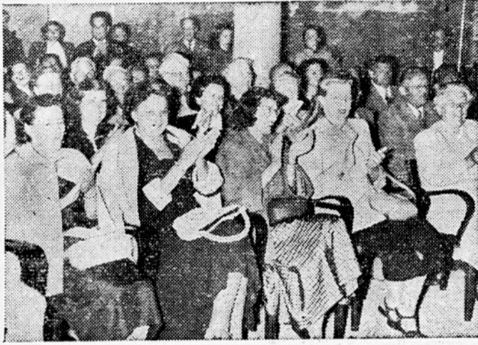
Progressivne Slovenke na koncertu v Ljubljani