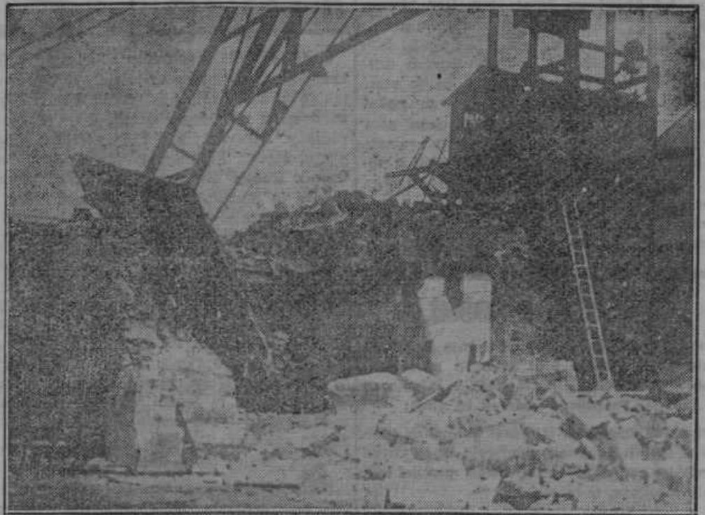
Eksplozija v čehoslovaškem premogovniku pri Duchovu. Nesreča je zahtevala 142 smrtnih žrtev. Doslej so potegnili iz rovov 13 mrtvih, drugi so še vsi po jamah.