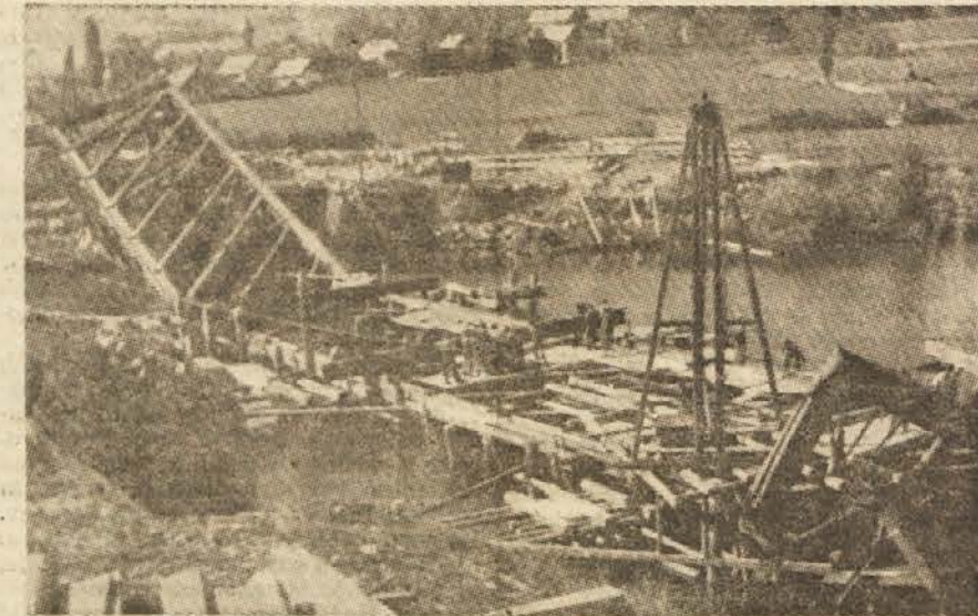
Začetek obnovitvenih del na mostu čez Kolpo pri Bujnarcih.

Istočasno z nameščanjem te konstruk- cije, ki je dolga okrog 30 m, so začeli graditi provizorij na ostali dolžini 50 m. Provizorij je sestavljen iz 5 lesenih koz na pilotih, čez katere so položeni železni nosilci in tračnice. Lesene koze, ki so visoke 15 m, bodo prenašale obtežbo pro- meta, kakor tudi obtežbo pri končni