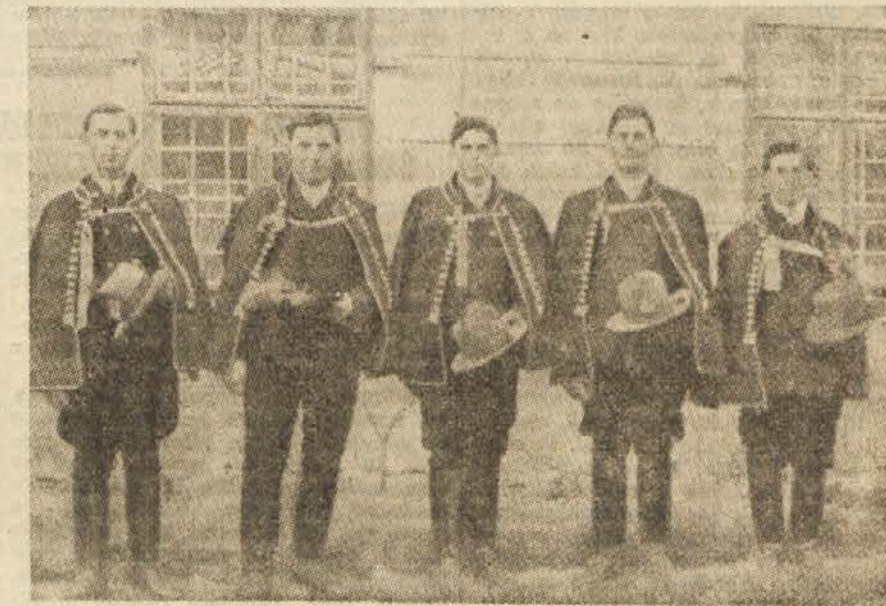
Parndorfski fantje v narodni noši.

Borba gradiščanskih Hrvatov za narodnostne pravice dobiva in bo dobivala v bodočnosti vedno bolj organizirane oblike. Pripravljenost poštenih in zavednih Hrvatov, brez ozira na strankarsko in svetovno nazorsko pripadnost sodelovati v borbi za narodnostne pravice, razočaranost širokih množic gradiščanskih Hrvatov nad kapitalantsko politiko vodstva OeVP in SPOe, povezanost narodnostne borbe gradiščanskih Hrvatov z delavskim naprednim gibanjem v Avstriji so faktorji, ki dajejo pravo perspektivo rešitve vprašanja gradiščanskih Hrvatov. Pravila rešitev vprašanja gradiščanskih Hrvatov je ena izmed izhodšč za demokratizacijo Avstrije. M. F.