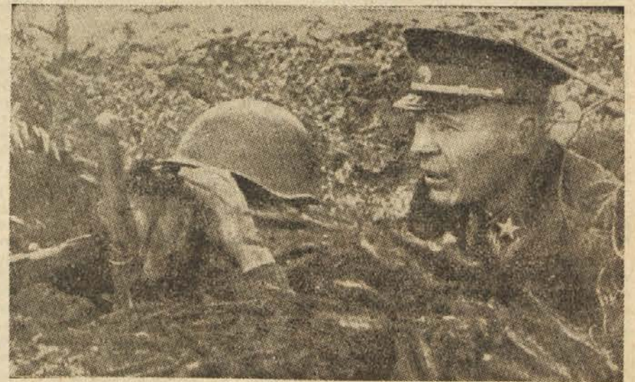
Maršal Timošenko opazuje na izvidnici potek ruskega napada.

Človek se takoj spomni na besede Lenina, ki je rekel: »Nikoli ne bo premagan tisti narod, v katerem je večina delavcev in kmetov občutila in videla, da brani vojo sovjetsko oblast, oblast delovnih ljudi, da brani tisto stvar, ki bo njena zmaga omogočila njim in njihovim