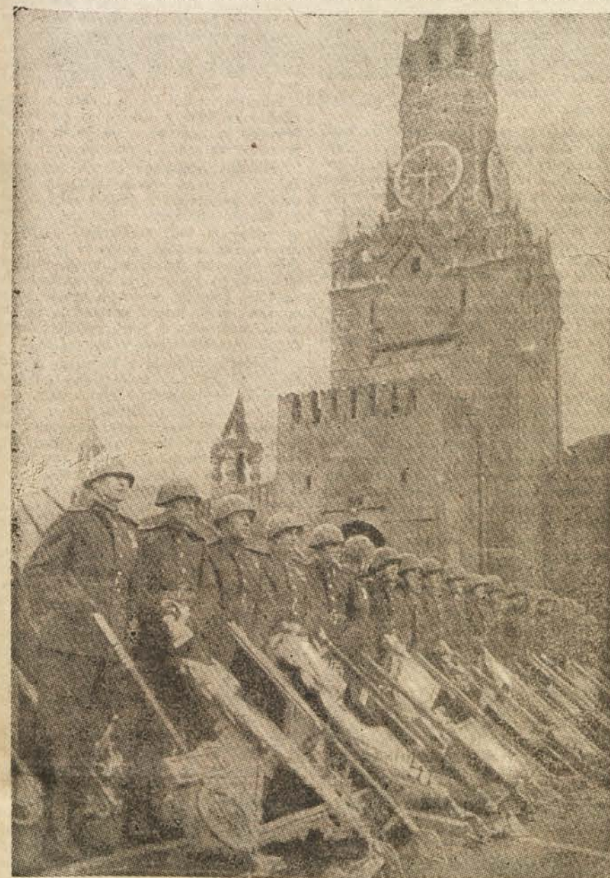
Parada zmage na Rdečem trgu v Moskvi. Rdečearmejci priklanjajo zastave premaganih nemških enot.

V naselju ni nobene hiše, nobenega drevesa, vse je razdejala nemška artilerija. Pod nogami se valjajo drobci granat. Več jih je, kakor odpadlega listja