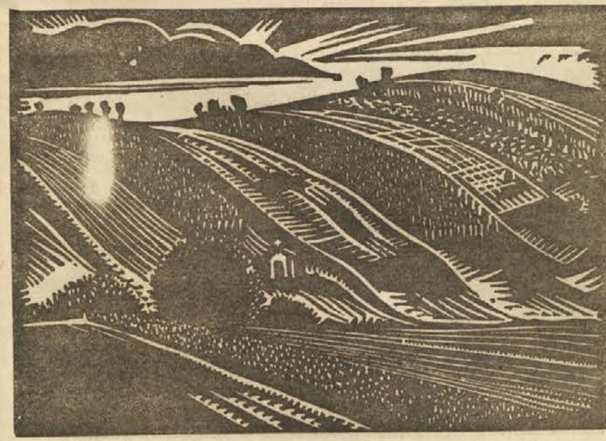
Klaudius: Gradiščanski kraj.