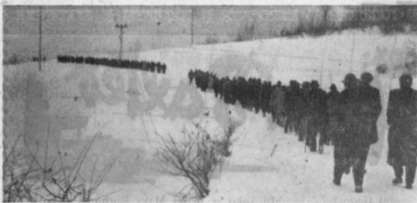
Tomšičeva »na pohodu« proti Drago mlji vasi

OB DVAJSETI OBLETNICI POHODA ŠTIRINAJSTE