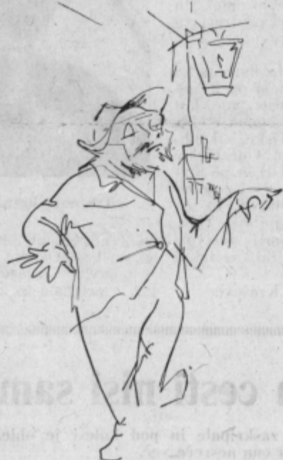
»Počakajte,« je rekel slikar...

»Tik pred polnočjo je našel sluga svojega gospodarja v knjižnici mrtvega.«