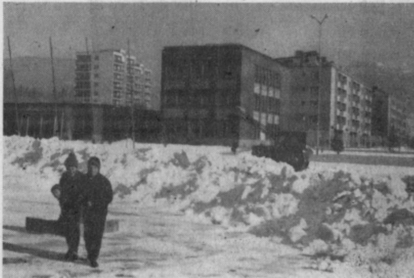
Velenje v snegu. Kot povsod, so snega najbolj veselji otroci. V Velenju imajo za to prav pripravne objekte

Z LETNE KONFERENCE KOMUNISTOV ŠTORSKE ŽELEZARNE