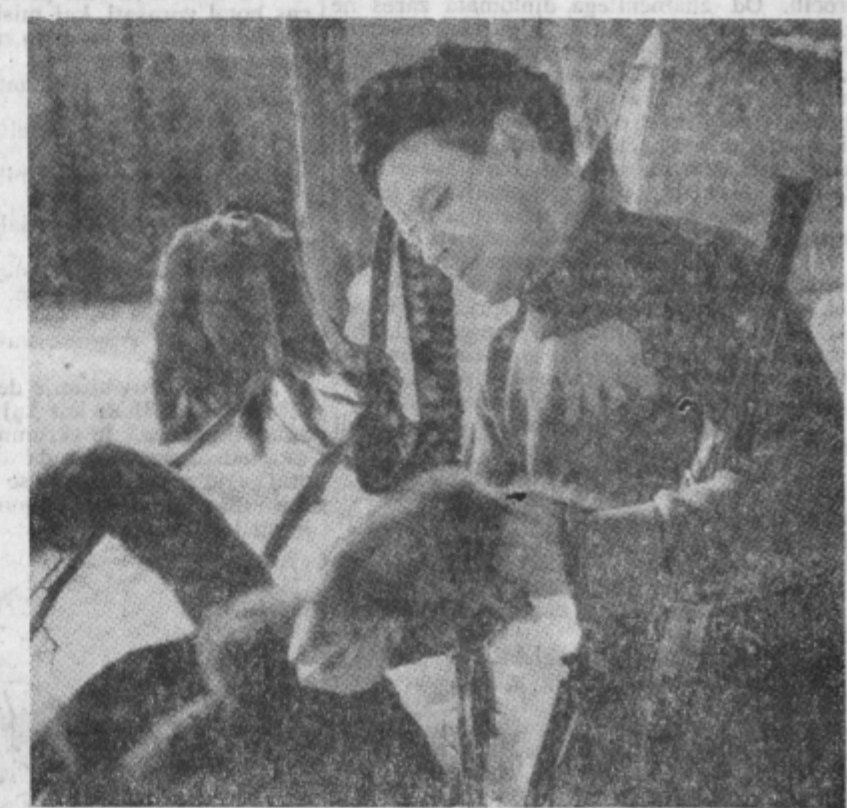
Trajnost krzna je odvisna tudi od tega, kje je strel zadel žival

Toda kljub veliki lovski spretnosti bi bil lovec brez moči, če ne bi imel s sabo vernega prijatelja in pomočnika — psa. Tega pri lovu na krznene živali ne more nič nadomestiti. Kakor v vsej Sibiriji je tudi v Gornjem Altaju največjega pomena lov na ververice. Te so tu zelo velike in imajo mehko sivo krzno. Pri lovu nanje se odlikuje zlasti pes, kakor mu pravijo — lajka. Ta izvoha ververico in jo goni z drevesa na drevo. Ko ververica recimo obstane na velikem boru, da lajka znamenje, lovec ustrelji in prva trofeja je za pasom. V dobri sezoni ulovi lovec dnevno tudi po dvanajst in več ververic.