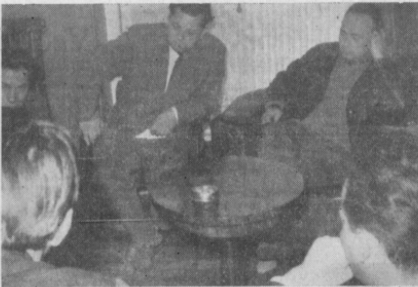
Rezignirani obrazi pričajo o kapitulaciji — nova cena si je utrla pot

Slučajno sem vpadel v zgoščeno razgovor gospodarstvenikov, ki so že tretjič premelevali pereče vprašanje podražitve in ker ni običaj, da bi o tem vodili zapisnik, sem namenil javnosti te vrstice. Usnjarji iz Kranja, Smartnega pri Slovenj Gradcu in Sošanju so se otekali pritiska tanincev. Predmet razgovora je bila podražitev tanina: hrastovega za 25 in kostanjevega za 35 dinarjev na enoto filter kilograma.