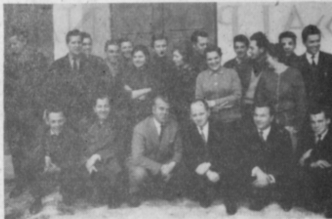
Tečajniki so se veselili, da so uspešno zaključili šolo, postavili pred reporterjev objektivi