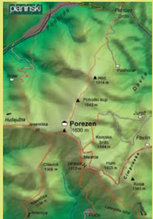
Zemljevida: Škofjeloško pogorje, 1 : 40.000 (Planinska založba), Škofjeloško in Cerkljansko hribovje, 1 : 50.000 (Geodetski zavod).

Vodniki: Jože Dobnik: Pot kurirjev in vezistov, Slovenska planinska pot ter Vodnik po planinskih kočah po Sloveniji (Planinska založba), Stojan Kenda: Pohodniške poti. Baška grapa in Šentviška planota (samozaložba).