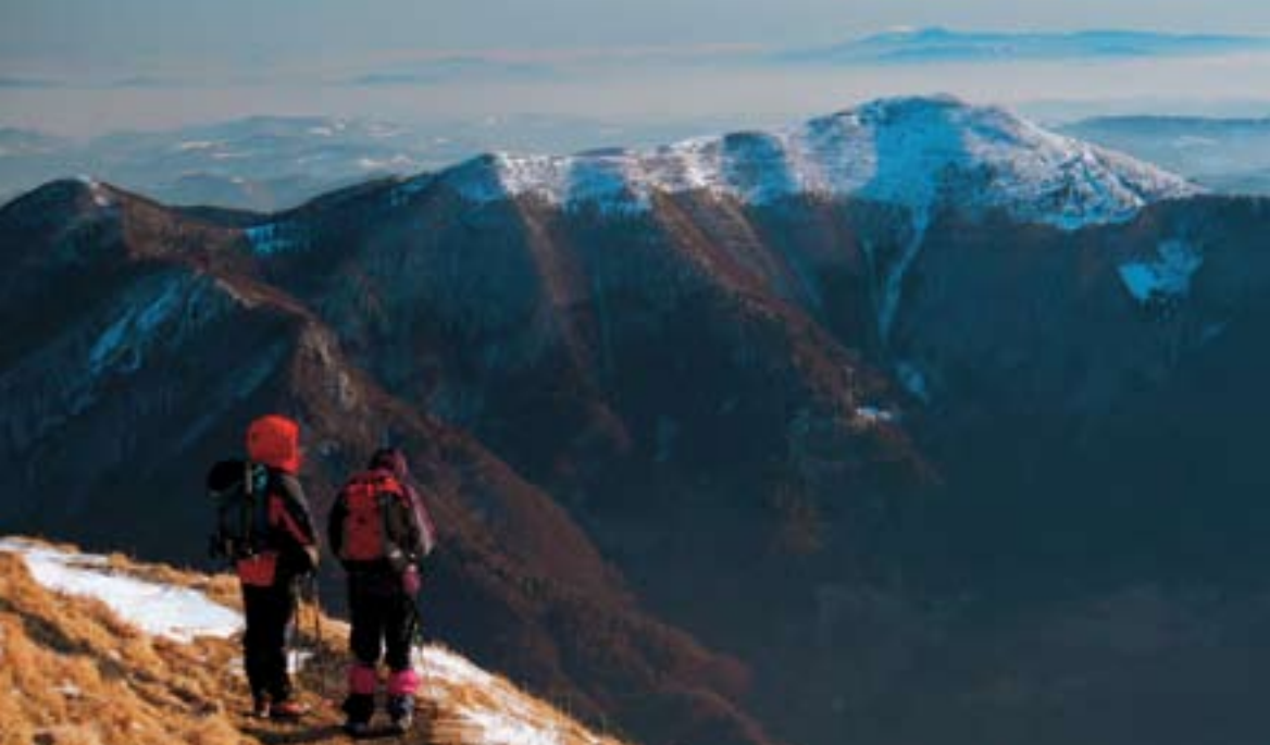
Porezen s Črne prsti