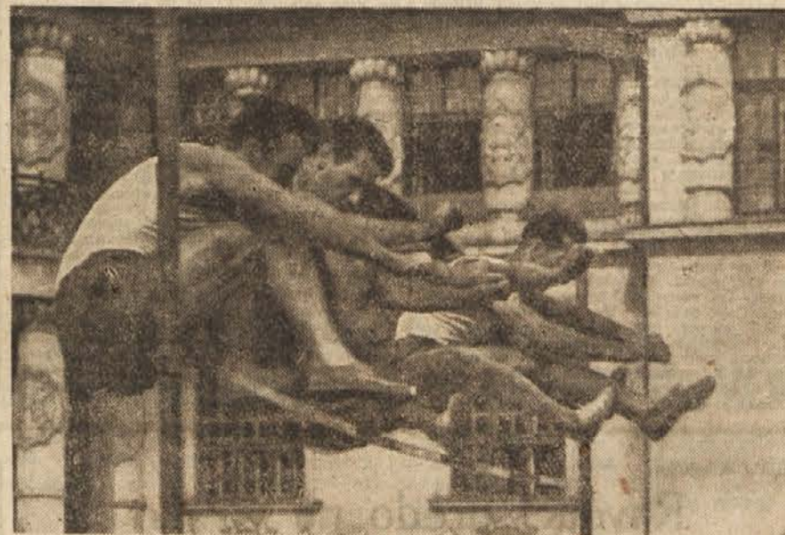
Gojenci Zavoda za fizkulturo skačejo v višino