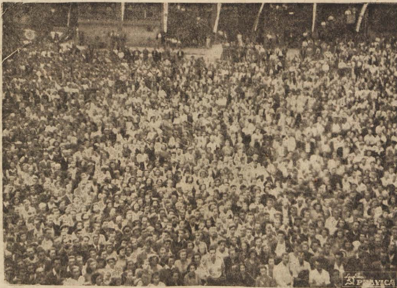
Pogled na množico zborovalcev na letnem telovadišču na Taboru med govorom tov. Edvarda Kardelja