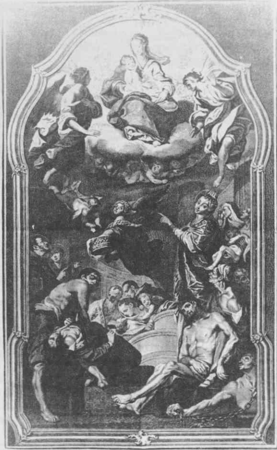
Grafika freske iz cerkve Mariahilf v Gradcu

Če pa bi Drava kdaj ponovno spremenila svoj tok, ter se vrnila v staro strugo, pa se bodo ti kamni, ki so po večini iz belega in črnega marmora ponovno pokazali in jih bo