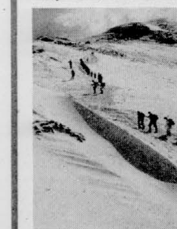
Po partizanskih poteh na Snežnik

Vojvodina zagovarja predlog, da bi morali rasti splošne in skupne porabe letos zmanjšati za 40 ali celo 50 odstotkov. Trdi namreč, da načrti za gospodarsko stabilizacijo ne bodo niti popolni niti primerni, če te rasti ne