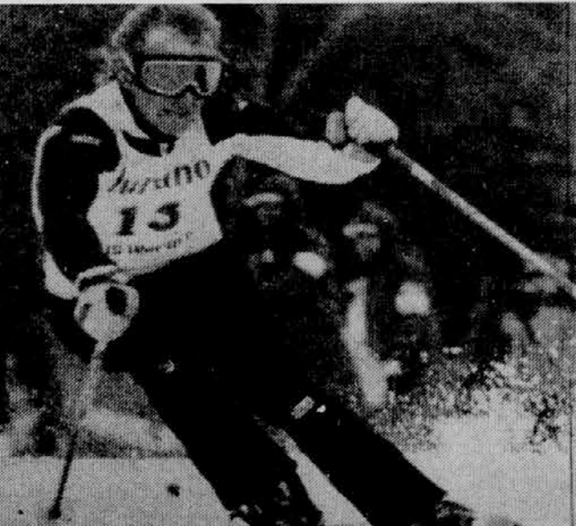
Nov velik Križajev uspeh

Po pričanju očitvecev pa je bilo v teh spopadih samo minulo noč veliko več mrtvih, kot navaja uradna policijska poročila. V zadnjih 14 mesecih je v bojih, ki jih vodi fronta za osvoboditev proti vladnim silam ter v pokolih, ki jih po mestih in vaseh nezakonavno izvaja skrajna salvadorska desnica, izgubilo življenje več kot 15 tisoč ljudi.