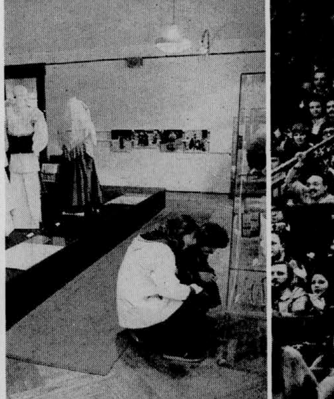
Premajhno zanimanje za umetniške razstave

O hudih poplavih poročajo iz ČSSR (kjer so mnoge reke preplavile nekaj tisoč hektarjev njiv,