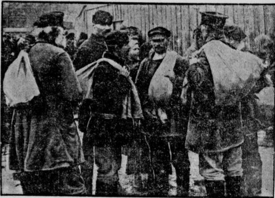
Beda ruskih kmetov raste od dne do dne. Pod pritiskom žitnih komisarjev in davčnih uradnikov so obubožale cele vasi. Kmetje zapuščajo svoje domove in gredo po svetu s trebuchom za kruhom. Na tisoče takih kmetov blodi posebno po južni Rusiji.

Jaka: »Svoje hčere mi ni hotel dati za ženo.«