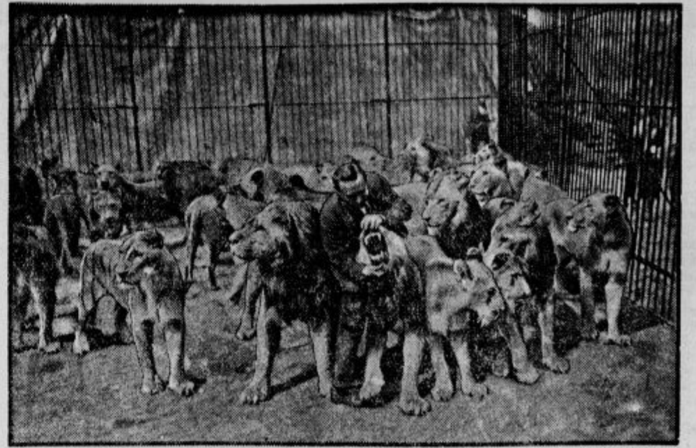
18 njegovih levov so zjutraj našli v kletkah mrtve. Ni še dognano, ali gre za zastrupljenje z mesom ali s plinom.

in po trdovratni obrambi sovražnika izgubila 54.158 mož.«