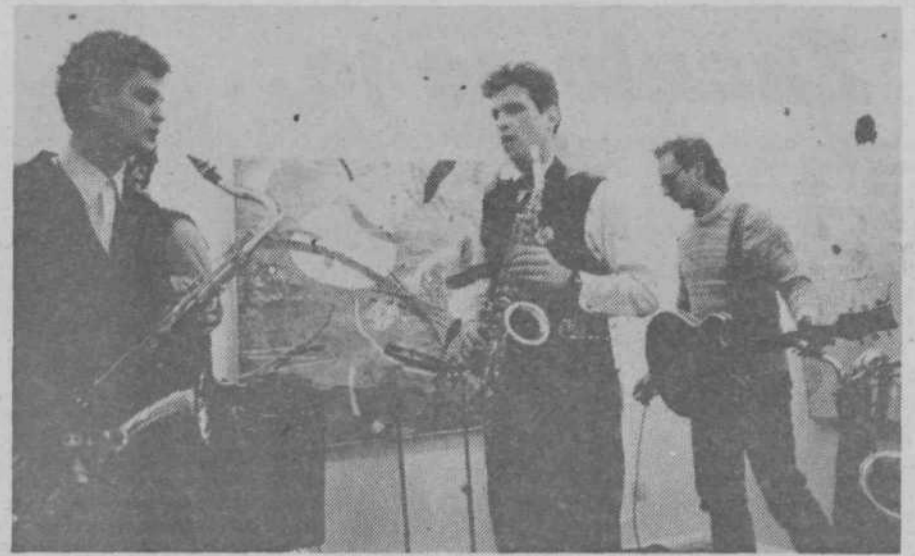
Del skupine Miladojka YOUneed.