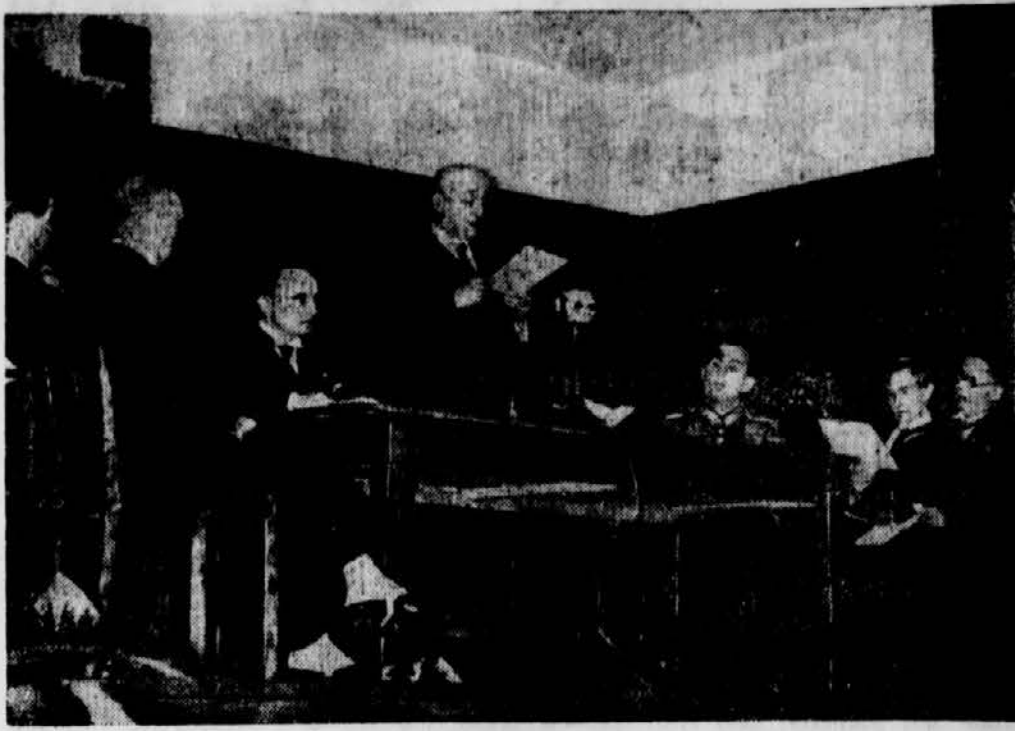
In Beograd tagt zur Zeit ein internationaler Polizeikongress, dem auch der deutsche Polizeigeneral D a l u e g e (in Uniform rechts am Tisch) bewohnt. Innenminister Dr. K o r o s e c liest die Eröffnungsansprache.