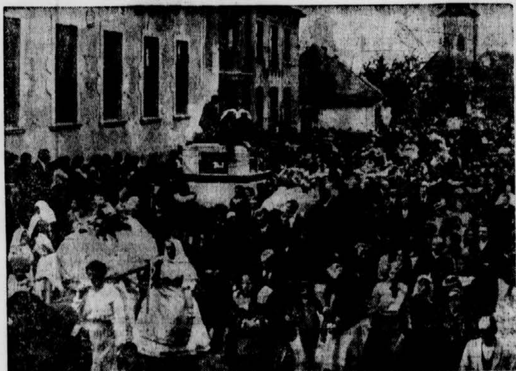
Die 31 Schuttlinder, die bei dem entsetzlichen Fährunglück auf der Thaya in der Nähe von Neumühl ums Leben gekommen waren, wurden jetzt belagert. Man sieht auf dem Bild den ergreifenden Trauerzug. Junge Mädchen und Knaben trugen die Särge von der Kirche in Nachitz zum Friedhof.