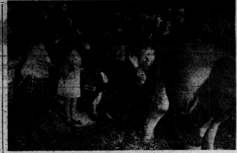
Slonji mladič cirkusa Adria, ki gostuje v Ljubljani, ima veliko mladih prijateljev.

V skrb za odpravo teh pojavov, ki vodijo v ekstenzivno proizvodnjo, bo treba angažirati vse družbene sile v komunah, kajti posledice velike suše bo mogoče ublažiti, če se organizirano usreliš različne ukrepe in vloži več naporov.