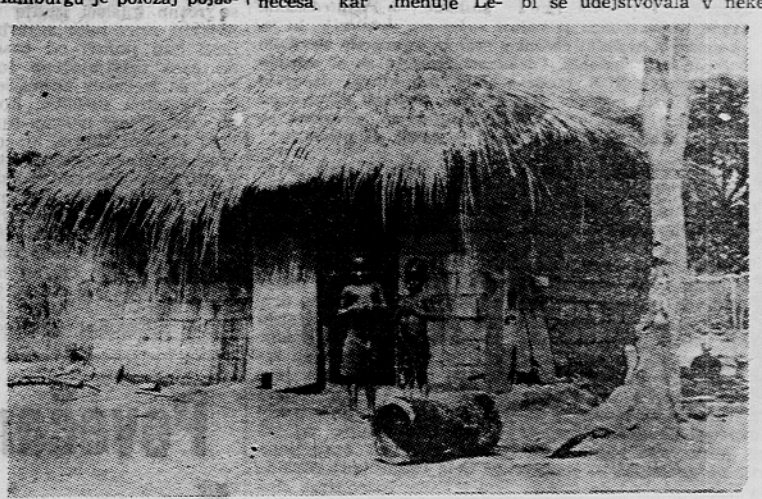
Kongoška vas - moderna koč

»Mesec dni v vaših ladjedelnicah je pri nas le teden dni. Komu smo lahko hvaležni za to? Vam!«