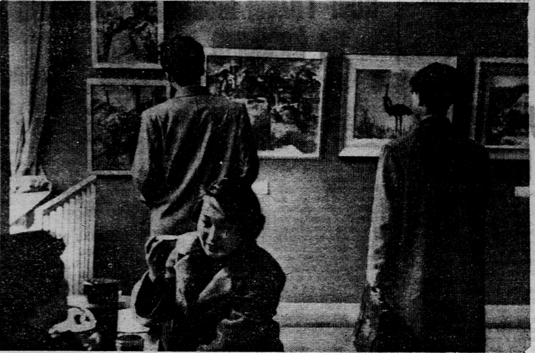
Umetnost in čajnica: sredi trgovskega lokala vabi k oddihu umetniška razstava, kjer gostu, ki je pravzaprav kupec, mimogrede postrežejo s čajem in prigrizkom

miselnost, po kateri je veljavna v družbi — v tem primeru med kupci — pogosto več kot sam denar, prav gotovo pa zahtevajo poslovne uspeha. Nemara prav zato so na starih veleblagovnic v Tokiju, milijonskem, močno prenaseljenem velenestvu, kjer silno primanjkuje parkov in sprehajališč, uredili prikupna zbirališča mladih in starih. Preden pridete do vrta na ravni stehi moderne, večnadstropne in po zahodnem vzorcu tako rekoč z vsem založene veleblagovnice, morate mimo množice reči, ki zagotavljajo tokijski trgovski hiši poslovni uspeh. Spotoma preberete vabila na umetniške razstave in gledališke prireditve, od katerih si postovni ljudje ne morejo obetati dobriča, vendar pa z njimi ustvarjajo značilno japonsko vzdušje, od katerega je odvisna kupčija. Na zunaj so veleblagovnice podobne z vsemi sodobnimi tehničnimi domisljicami opremljene v vitezskim gradom, saj ima vsaka izmed njih celo stolp, s katerega plapolata zastava. Ce ne bi bilo v nasprotju s policijskimi predpisi, bi japonski trgovci zelo verjetno vsaj simbolčno oborožili svoje nameščenke in uprizarili roparske napade, samo da bi se v kupcu nakopičilo kar največ nevsakdanjih doživetij.