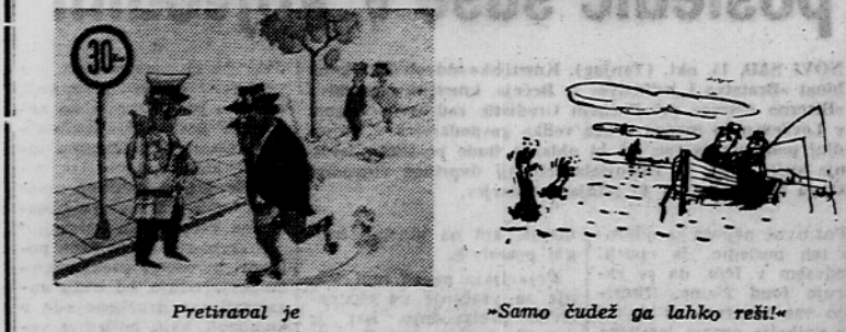
Pretraval je - Samo čudež ga lahko reši!