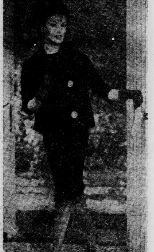
Pleten kostim v temnejših, jesenskih barvnih tonih bo tudi letošnjo jesen praktično oblačilo, pozimi pa ga bomo nosile pod plaščem

Vsaka, ki se bo odločila za usnjen plašč ali jopič, mora vedeti, da je le-ta izrazito sportni kos garderobe, primeren za potovanja, službo in podobno, a nikakor za slovesne priložnosti, in ko bo imela na sebi usnjen plašč, se bo morala odreči visokim petam in dalji prednost ruti, oziroma športni čepici. S.M.