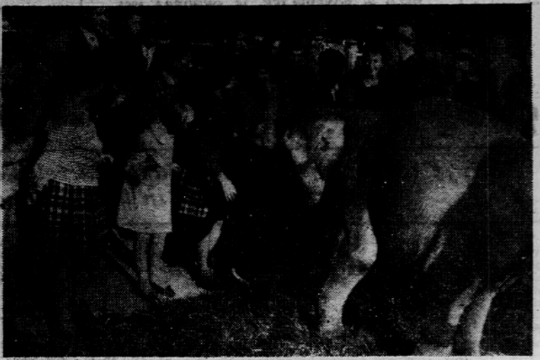
Slonji mladič cirka Adria, ki gostuje v Ljubljani, ima veliko mladih prijateljev.

Peking, 15. oktobra (TASS). V Pekingju so danes objavili uradno sporočilo o obisku nepalskega kralja Mahendra LR Kitajske in o razgovorih, ki jih je imel z najvišjimi kitajskimi funkcionarji. Predsednik republike Liu Sao Ci, in premier Ču En Laj sta sprejela povabilo, naj obiščeta Nepal.