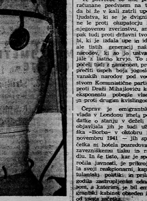
Za neko francosko družbo je zgradil italijanski inženir Galeazzi potapljaško napravo za znanstvene in tehnične raziskave v Sredozemskem morju in na Atlantiku. Nekaj podatkov o potapljaški gondoli: višina 240, premer 117 cm, teža 1,2 tona. Po dva raziskovalca v njej se bosta potapljala večmora 600 m globoko, vendar je naprava grajena tako, da bo kljubovala vodnemu pritisku do globine 1800 m.

V neki večji francoski šolski ustanovi so uredili poseben oddelek za učence, ki imajo tako ali drugače slabši vid kot njihovi vrstniki. V oddeleku je strop bel, stene svetlozeleno, vsa oprema iz naravnega lesa, vsaka klopa pa ima lučko. Razen tega so posvetili posebno skrb osvetlitvi šolske table. V tako urejeni učilnici dosega kratkovidni in drugi učenci s slabšim vidom bolj znatno boljše uspehe, kot so jih doslej.