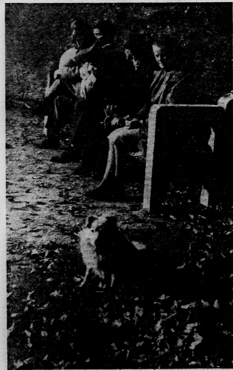
Ko se sonce posavlja. Motiv iz Tivola

liko Britanijo na eni ter Zahodno Nemčijo in Fran-cijo na drugi strani. Dosegli bi naj skupno stališče o sta-tusu zahodnega Berlina, o vprašanju jedrske oho-rožitve Zahodne Nemčije, o eventualnem razvoju odno-sa med ZDA in Sovjetsko zvezo, iz-javljajo v washingtonskih diplomatskih obveščenih krogih, da je bil dosežen načelni sporazum o nujno-sti nadaljevanja razgo-vorov. Dodajajo, da je ameri-ški zunanji minister Dean Rusk v razgovorih z Grom-ikom dobil vtis, da se Sov-jetska zveza resno zavez-je za razgovore in da je pripravljena dati pisnene garancije glede vprašanja komunikacij med Zahodno Nemčijo in zahodnim Berli-nom preko ozemlja DR Nemčije. Med posvetova-njem, ki je bilo v načrtu, bi naj odstranili nasprotja v stališčih med ZDA in Ve-