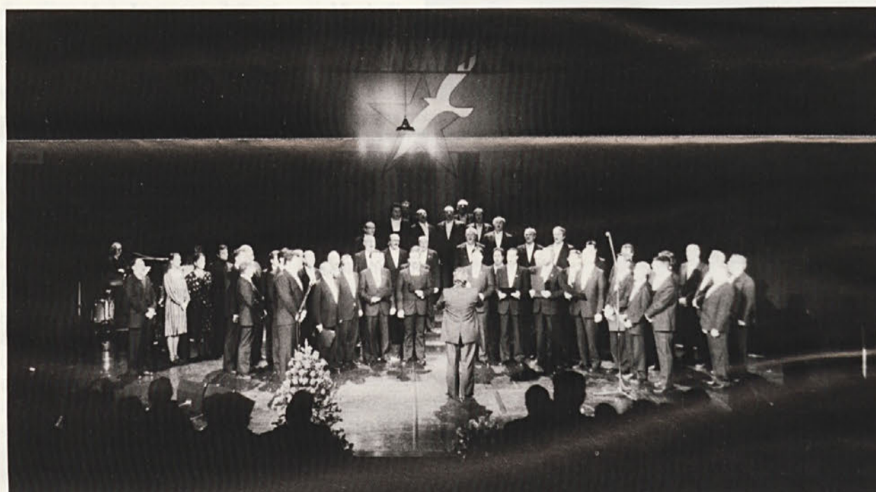
V petek, 26. novembra 1993 je bila v Kulturnem domu v Trstu proslava ob 50-letnici Partizanskega dnevnika, predhodnika Primorskega dnevnika.