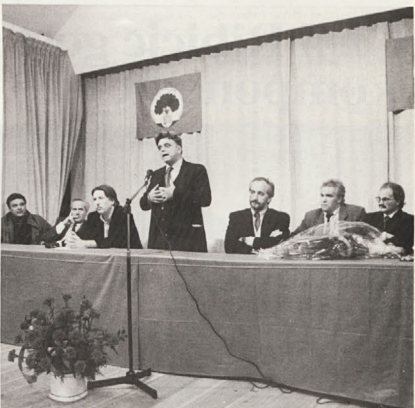
Vsodržavni tajnik Achille Occhetto nas je pred tedni obiskal najprej v Gledališču Miela, nato pa se je srečal s Slovenci v Trebčah, kjer je bil deležen prijetnega sprejema.