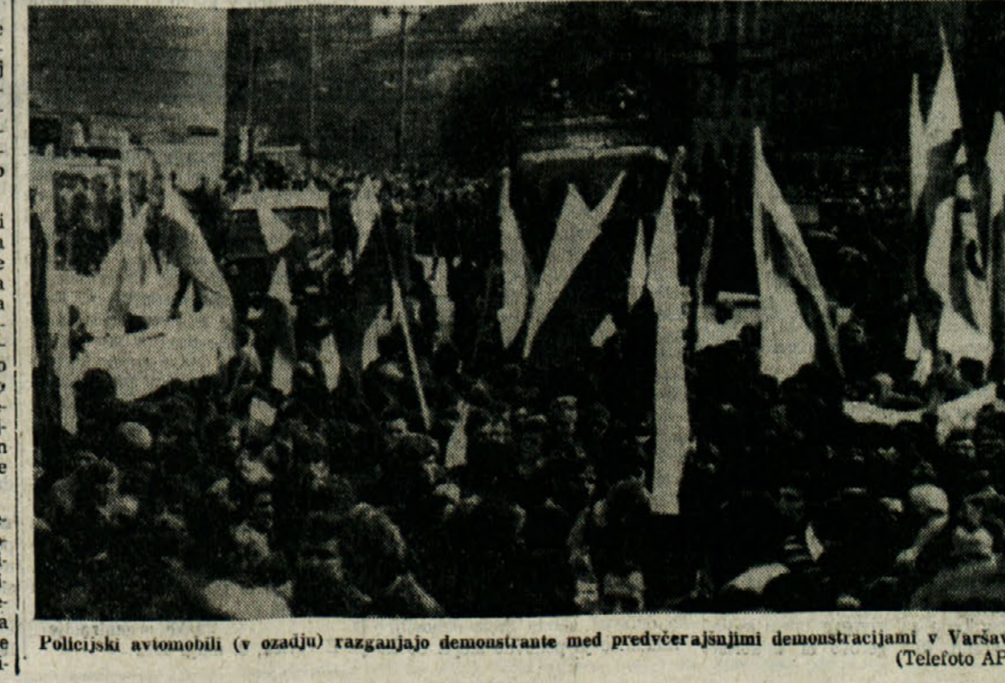
Policijski avtomobili (v ozadju) razganjali demonstrante med predvčerajšnjimi demonstracijami v Varšavi