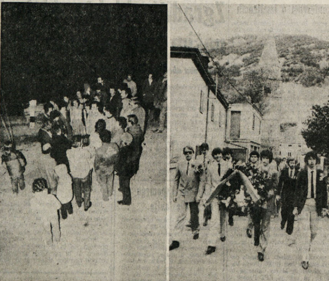
Na predvečer mednarodnega praznika dela 1. maja so tako v Borštu, kot v Boljuncu postavili mlaje. Na levi slovenska pesem po postavitvi mlaja sredi Boršta. V Boljuncu pa pred fantovskim uros 1. maja mladi Boljuncani odnesli venec pred spomenik padlim partizanom