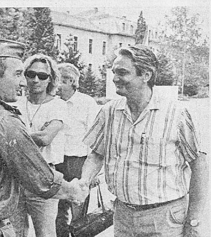
V Vinkovcih ni več slovenskih vojakov LJUBLJANA, 6. avgusta - Danes ob 5. uri je iz Ljubljane odpeljal avtobus s starši, ki so odšli v Vinkovce po svoje otroke, slovenske vojske v JA. Vojna po zastražitvi prazni avtocesti Bratstva in enotnosti se je za marsikatero starša ubrzo vlekla, sprejem staršev v vojašnici pa je bil prijazen. Kljub temu sta bila obvozna kavica in klepet v vojaški kantini kar nekam predolga, saj se je vsem s tega kriznega žarišča mudilo domov. (N. K.)