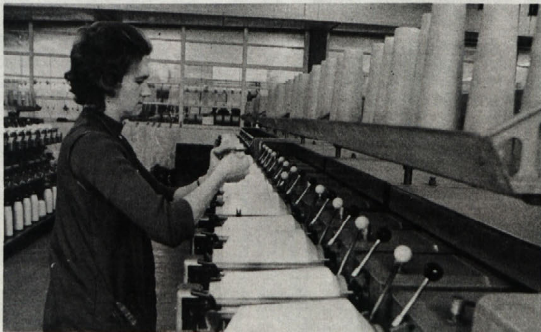
Osem ur za strojem, nato pa še delo doma. Ostane ženskam kaj časa za razvedrilo, smeh in rekreacijo?