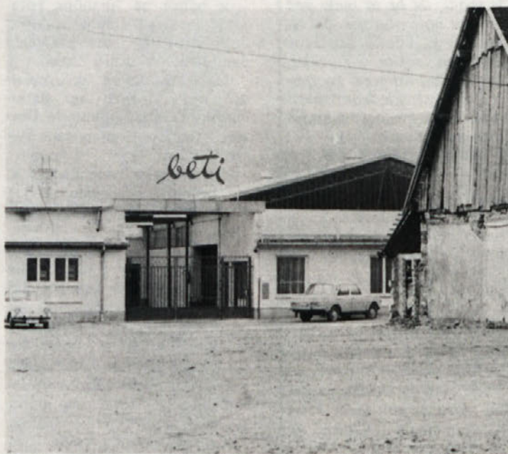
Okolico naše stavbe v Mirni peči urejajo zlasti mladinci, ki bodo uredili tudi igrišča za šport. Stavba pred poslopjem BETI pa nikakor ni v ponos ne tovarni in ne Mirni peči