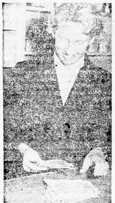
Poslovodkinja parfumerije »Nade« je bila navdve zadovoljna z doseženim prometom.

»Moja« je trgovina, ki jo najbolj »obrajajo« pozabljive ali uslužbene gospodinje. Kmalu, ko smo vstopili v ta lokal, smo temu tudi verjeli. Reporterka non-stop radovednost nas je seznanila z gospodinjo, doma za Bežigradom. »Mar niste utegnili čez dan nakupiti živila?« je bilo naše vprašanje. »Ne, ker imam delten delovni čas. Tudi jaz sem namreč v službi pri podjetju »Tabak«. Jutri je nedelja in mi je zmanjkalo olja ter soli,« je pojasnjevala. Poslovodja pa nam je pothotoma izza prodajne mize dejala, da so menda gospodinje kar takale na non-stop ulici. To svojo domnevo je utemeljeval z izredno visokim prometom, ki so ga popoldne in ta večer imeli.