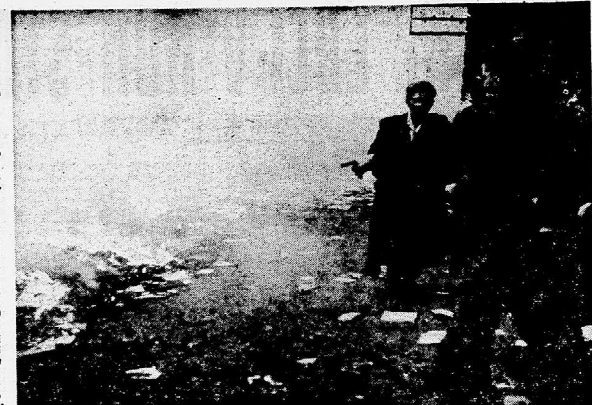
Budimpeštanska ulica po enem izmed neredov

Tel Aviv, 6. nov. (AFP). Sovjetski veleposlanik v Tel Avivu Aleksander Abramov, ki ga je bila večeraj sovjetska vlada odpoklicala, je davi obiskal Izraelskega zunanjega ministra Goldo Meir pred vrnitvijo v Moskvo. Po obvestilih iz diplomatskih krogov je sovjetski veleposlanik ob tej priložnosti izrazil izraelskemu ministru novo deklaracijo sovjetske vlade.