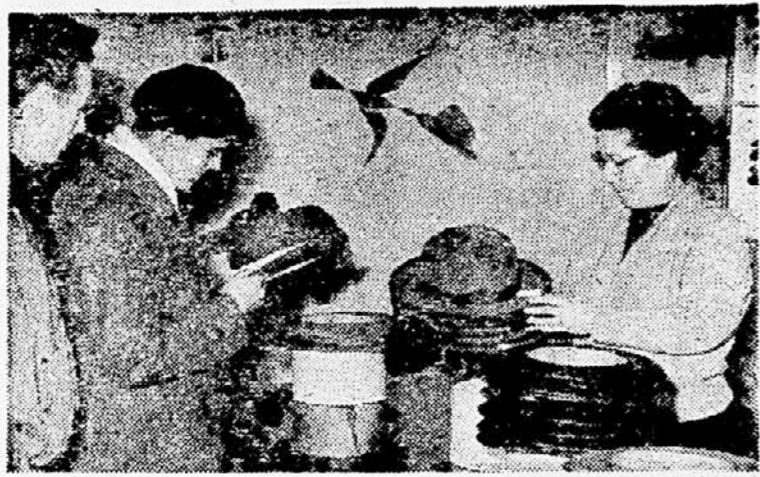
Moška in ženska pokrivala v trgovini »Velur« so bila navzile pozni uri deležna zanimanja in ogledovanja.

»Ne hvala, ne bomo se ne strigli in ne brili, pač pa...« Tako in podobno smo prvi sobotni večer v novembru se opravevali v ljubljanski non-stop ulici. Če pri »Sionu« smo v brivskem lokalu pobarali, kako in kaj gre z neprekinjenim delom od jutra do večera. Vidljivo so nam povedali, da za njih velja non-stop že od lanskega aprila. Ali vsestransko kaže po tem sistemu obratovati, pa nismo spraševali, kajti ta čas je v tej pozni uri potrepeljivo čakalo na britje več dokaj dlakavih brad. Predno smo nadaljevali pot, so nam dejali, da čisto »potegnejo« se čez non-stop.