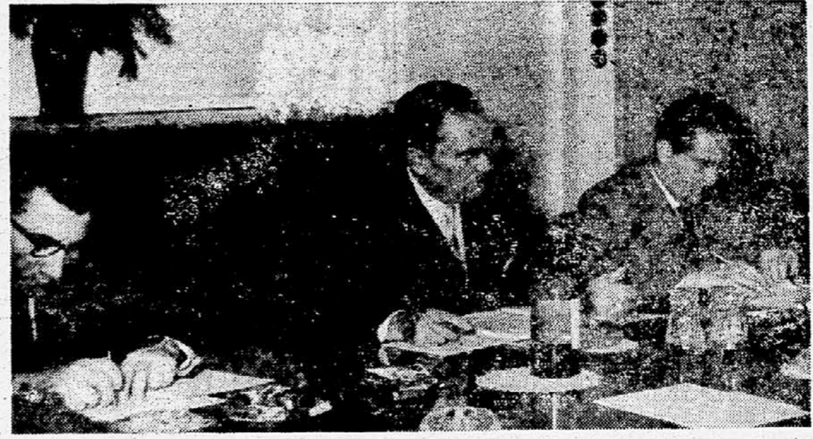
LJUBLJANA, 6. nov. Pod predsedstvom tovariša Tita je bila danes v Ljubljani razširjena seja Izvršnega komiteja CK ZKJ. Na seji so v zvezi s pripravami za družbeni plan za leto 1957, kakor tudi za perspektivni plan proučevali osnovna vprašanja naše gospodarske politike v prihodnjem letu. Izvršni komitej CK ZKJ je sklenil predlagati Centralnemu komiteju, naj bi bil jeseni 1957 VII. kongres ZKJ. Izvršni komitej je izvolil komisijo za izdelavo načrta programa ZKJ, ki ga bodo predlagali VII. kongresu. Izvršni komitej je izvolil tudi komisijo za proslavo 39. obletnice Oktobrske revolucije.

KAIRO, 6. nov. (AP). — Egiptovska vlada je davi poslala poziv vsem državam, naj pošljejo Egiptu pomoč v prostovoljnih in orožju. Poziv, ki ga je objavil egiptovski urad za informacije, se glasi: »V tem usodnem zgodovinskem trenutku, ko gre za obrambo pridobitev človeštva in ko je človeštvo vrženo nazaj v kaos in divjaštvo, ko so Francija, Izrael in Velika Britanija podlo napadle Egipt in ko nesramno razvijajo zastavo nezakonnosti in sramote, poziva Egipt vse tiste v svetu, ki jim je še do človeškega dostojanstva in zakonitosti v mednarodnih odnosjih, da mu pošljejo prostovoljce, orožje in vsako drugo pomoč. Egiptovsko ljudstvo — je