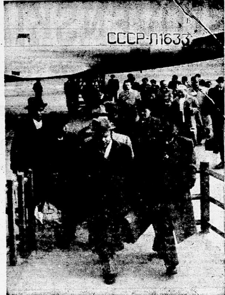
Predvčerajšnjim je prispela v Beograd burmanska kulturna delegacija, ki jo vodi burmanski minister za kulturo in prosveto U Htu Tin