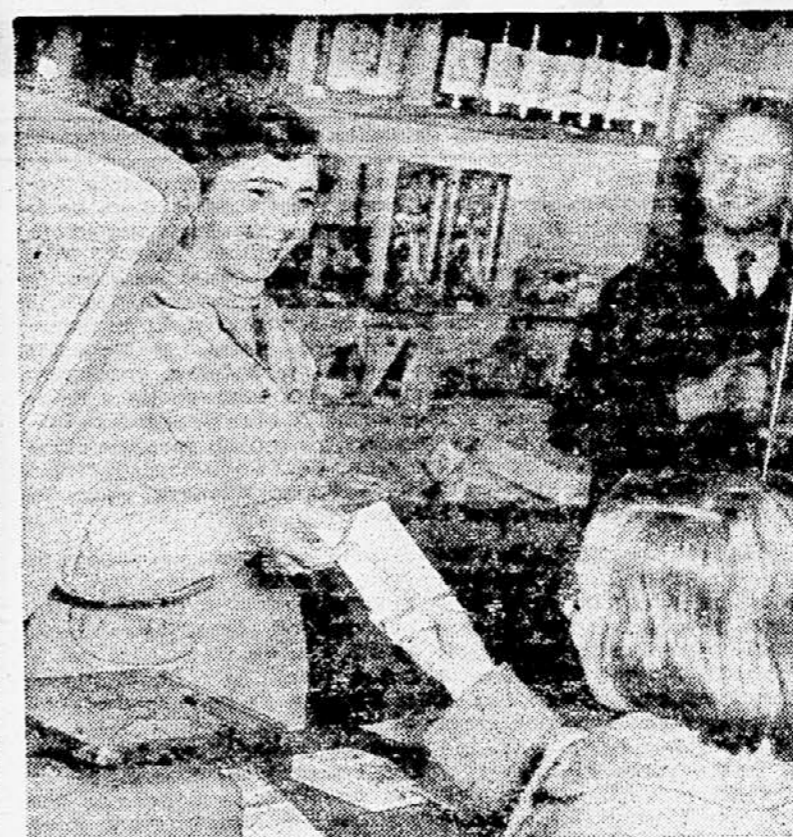
Cas se je nagnil že čez sedmo zvečer, ko smo v trgovini »Moja« v Nazorjevi ulici naredili ta posnetek

Kazalec na uri je kazal že skoraj 8. uro, ko smo naglo za seboj zaprli vrata papirnice Mladinske knjige. Uvod je bil enak kot v prejšnjih lokalih in že smo bili pri podatkih, ki tudi v prid trgovine pričajo ugodno o non-stop sistemu. Z občutkom, da smo zaključili naš strokovni pohod po non-stop ulici, smo se nekaj minut zatem sredi nje oddahnili. Kaj pa potem? Šli smo naprej. Novinarski non-stop je pač nedoločen.