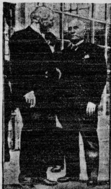
Angleški zunanji minister Simon in Mussolini med sestankom v Rimu.

* Kaj hočejo Bolgari od Romunov. Češko časopisje poroča iz Sofije, da namerava bolgarski kraljevi par obiskati romunskega kralja Karla 21. januarja in ostati v Bukarešti do 24. januarja. Pri tej priliki se bosna vladarja pogovarjala o vprašanjih, ki sta jih načela pri zadnjem sestanku, predvsem pa o pravih spomenice, ki jo je sestavila bolgarska vlada o svojih zahtevah do Romunije. V tej spomenici gre v prvi vrsti za bolgarske šole in cerkve v Dobrudži. Bolgarija zahteva