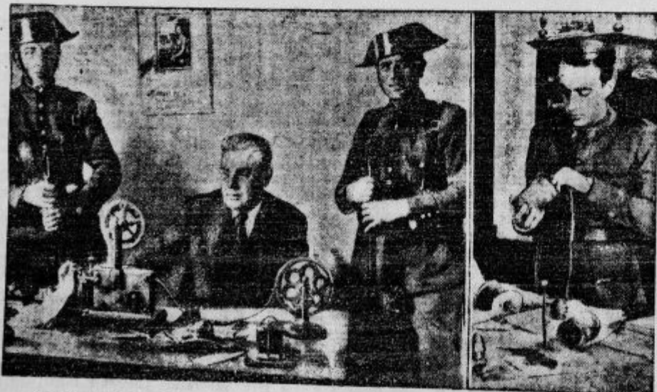
Španska vlada je stalno pripravljena na nove nemire. Anarhistična nevarnost še ni popolnoma odstranjena. Dan za dnem romajo v zapore anarhisti. Na podobi vidimo uradnika v brzojavnem uradu v Cordobi ki opravlja svojo službo pod varstvom policije. — Na desni ureizkuje artiljerijski častnik bombe, ki so jih položili anarhisti.

6000 katoliških zdravnikov se je zbralo 16 dni na kongresu v Dublinu. Se ne sramujejo vere!