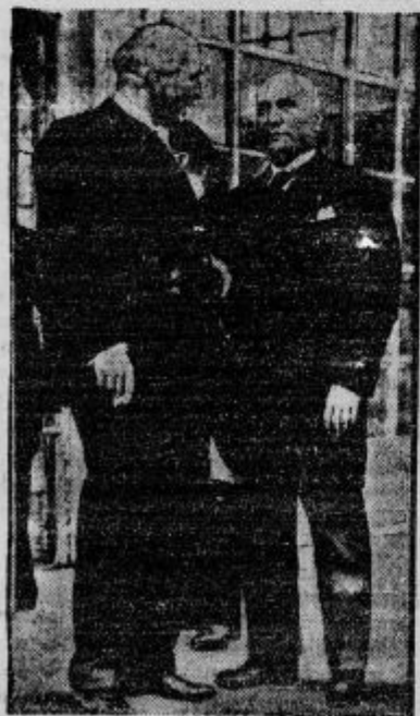
Angleški zunanji minister Simon in Mussolini med sestankom v Rimu.

s Kaj hočejo Bolgari od Romunov. Češko časopisje poroča iz Sofije, da namerava bolgarski kraljevi par obiskati romunskega kralja Karla 21. januarja in ostati v Bukarešti do 24. januarja. Pri tej priložnosti se bosla vladarja pogovarjala o vprašanjih, ki sta jih načela pri zadnjem sestanku, predvsem pa o pravih spomenice, ki jo je sestavila bolgarska vlada o svojih zahtevah do Romunije. V tej spomenici gre v prvi vrsti za bolgarske šole in cerkve v Dobrudži. Bolgarija zahteva