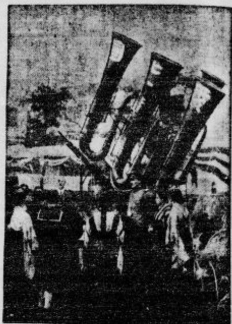
Tudi ženske se na Japonskem navdušujejo za vojno, kakor nam priča tale slika. Zbrale so namreč toliko denarja, da so lahko kupile armadi nove prisluševalne naprave, ki naj opozori na sovražno letalo.