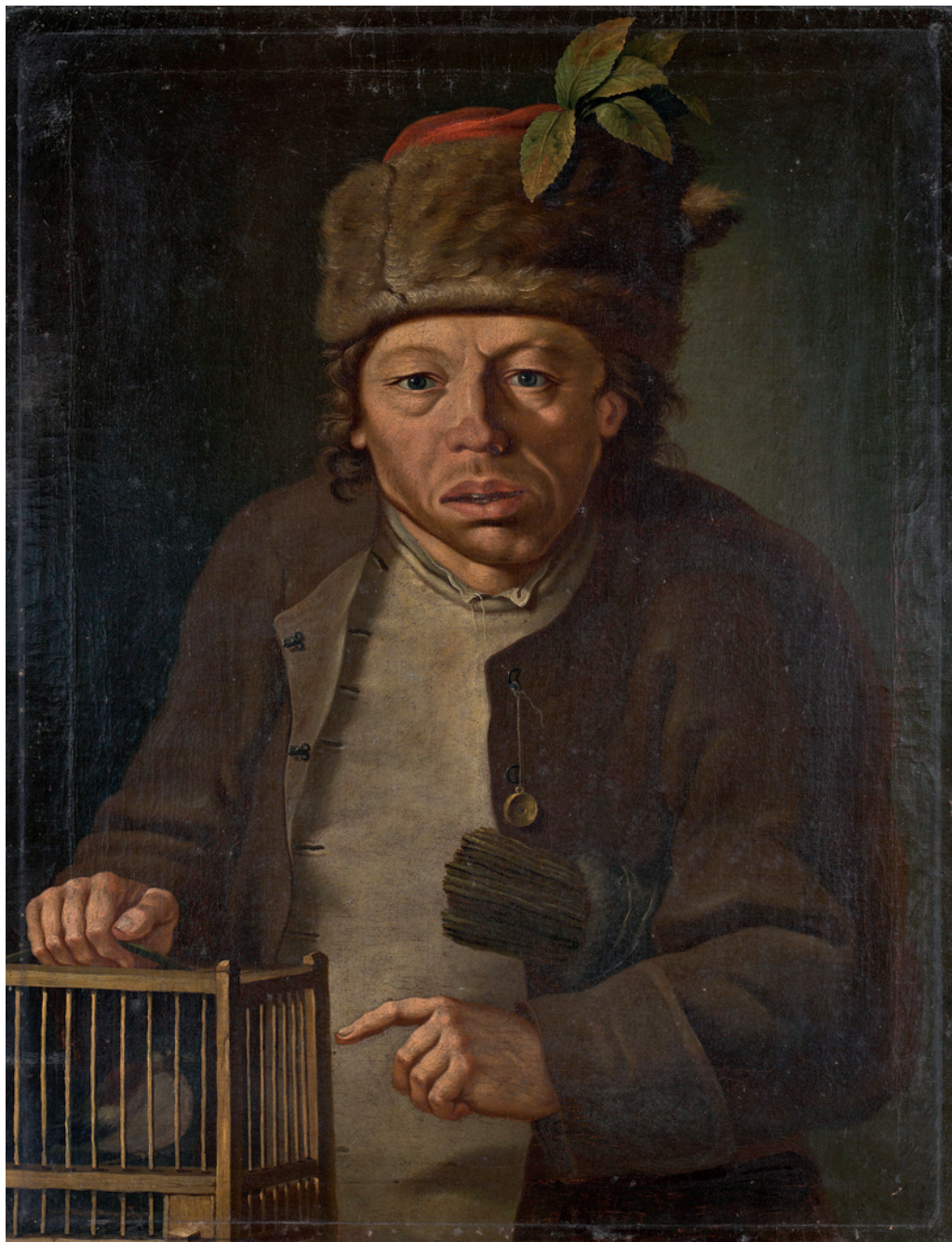
[ŠERBELJ 2] Fortunat Bergant, Ptičar , 1761. Ljubljana, Narodna galerija (stanje ob pridobitvi)