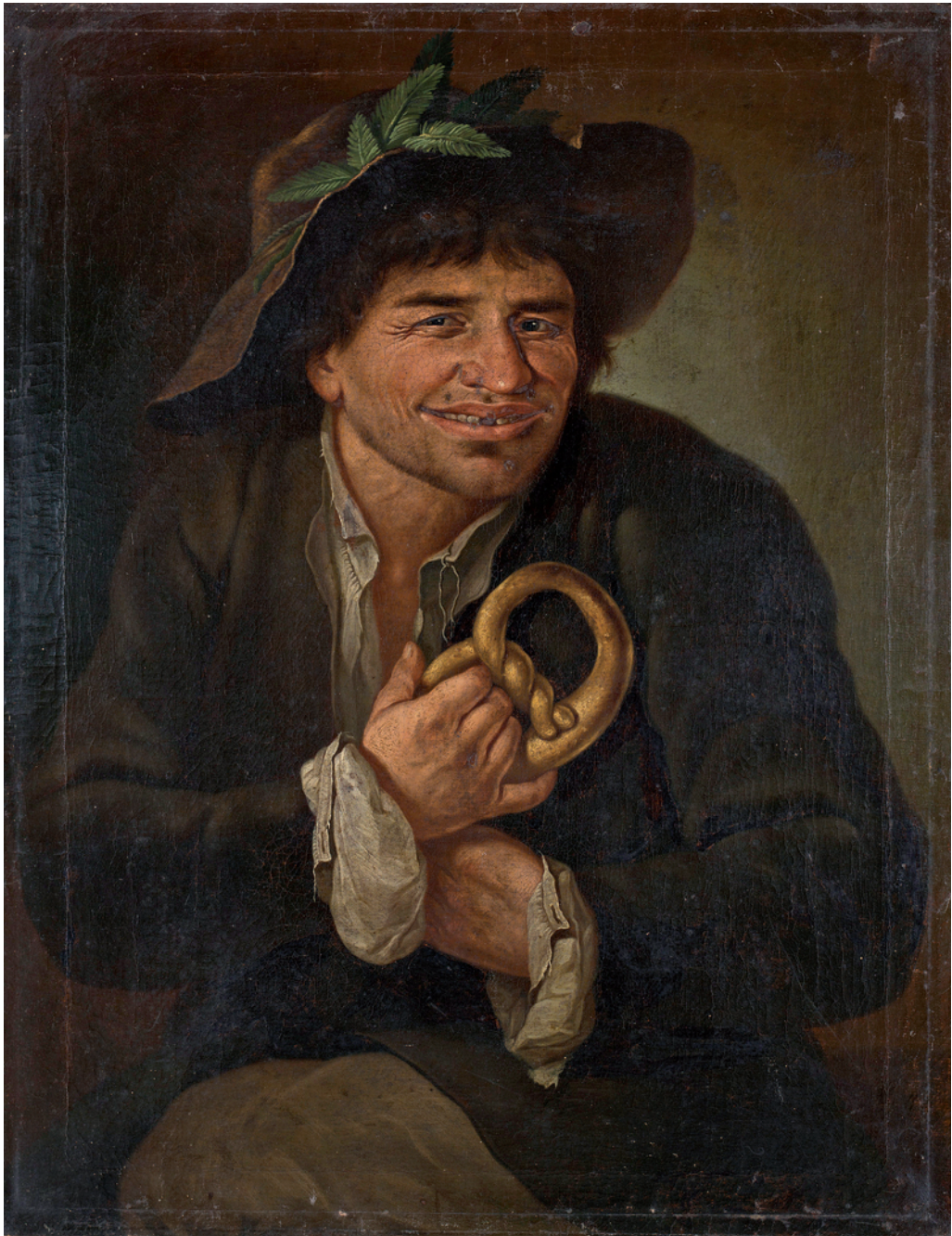
[ŠERBELJ 1] Fortunat Bergant, Prestar , 1761. Ljubljana, Narodna galerija (stanje ob pridobitvi)